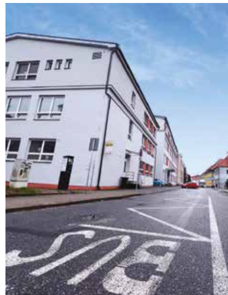
Zastávka MHD v Kollárově ulici.

„Nádraží ve Starém Městě nabízí kvalitní a rychlé spojení Uherskohradištska se zbytkem kraje i významnou částí střední Evropy. Paradoxně ale cesta na nádraží někdy cestujícím trvala déle než samotná jízda vlakem.