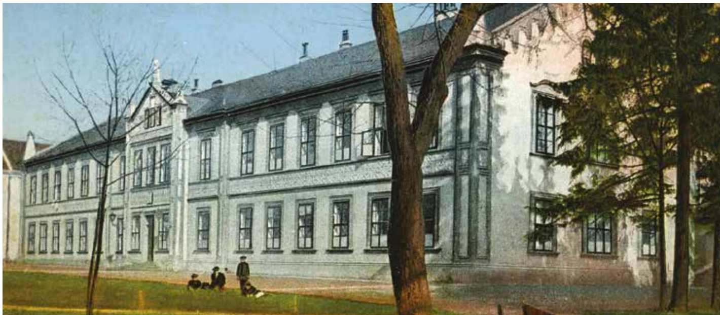
Německé gymnázium na počátku 20. století. Dnes v budově sídlí obchodní akademie.

Letos si připomínáme 170 let od zřízení reálky a 160 let od vzniku nižšího reálného gymnázia