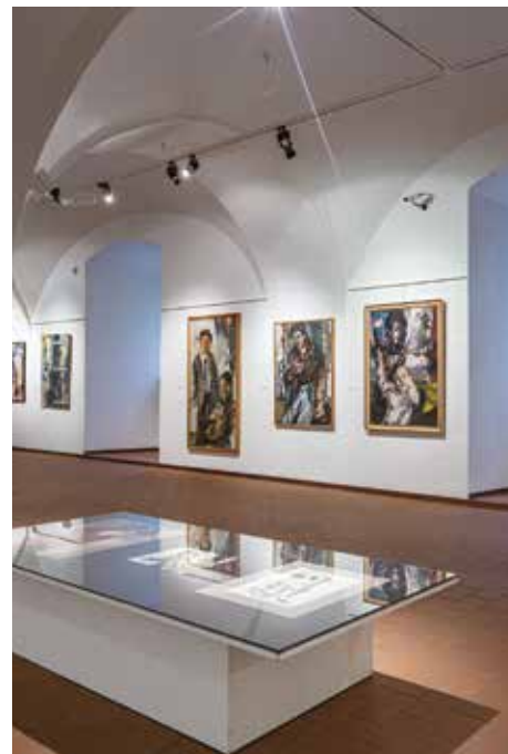
Výstava v Galerii Slováckého muzea.

Ať už maloval cokoli, bylo to vždy se zápalem připomínajícím boxerský souboj. Maloval opilce nočních barů i krásy v nesnázích, barvy filmových plakátů a blues temných uliček, přeplněné popelníky nádražních hospod, donkichotské hrdiny a v neposlední řadě také determinující