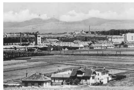
Areál s dominantou vodárenské věže ve 30. letech.