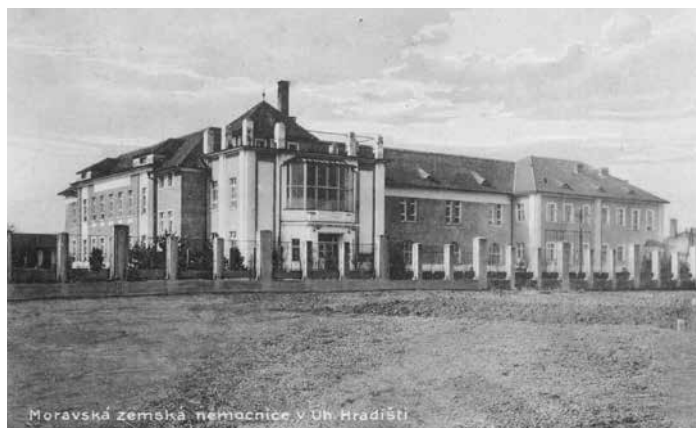
Budova chirurgie kolem roku 1930.