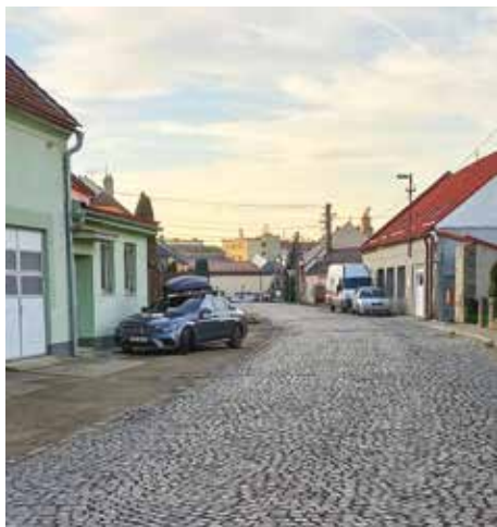
Oprava ulice Na Svárově v Jarošově bude stát přes 20 milionů korun.

V roce 2024 město dále počítá například s 57 miliony korun na projekt