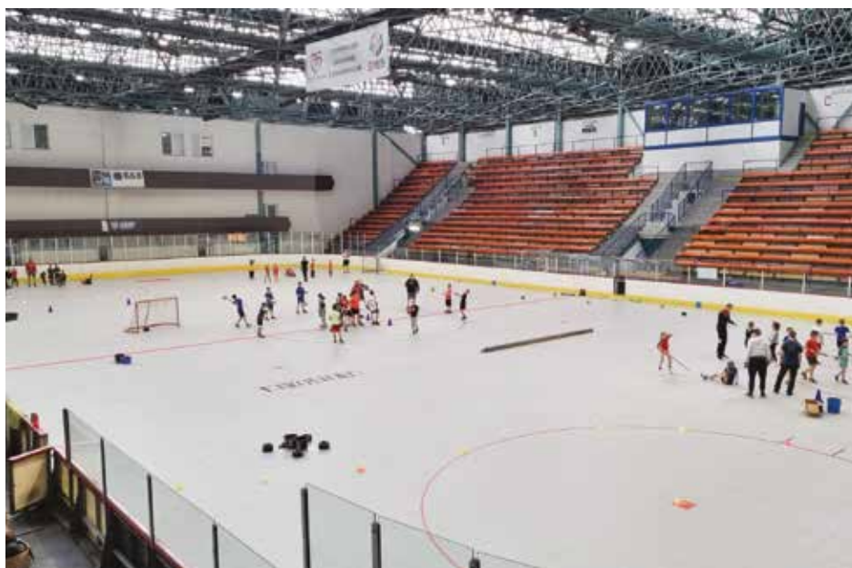
Pro rok 2024 je v rozpočtu města na nový zimní stadion vyčleněno 70 milionů korun.

energetických opatření ve sportovní hale, který začal už vloni. Cílem je zlepšit bilanci celého objektu ve spotřebě energií, přičemž očekávaná roční úspora energie by měla dosáhnout výše přesahující 1 milion korun. Počítá se rovněž se zahájením výstavby fotovoltaické elektrárny v areálu aquaparku, která bude sloužit také Základní škole Sportovní, na projekt je letos vyčleněno 29 milionů korun.