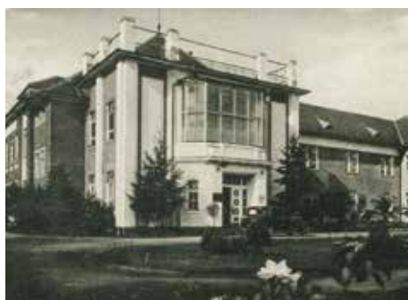
Budova chirurgie v první polovině 40. let.