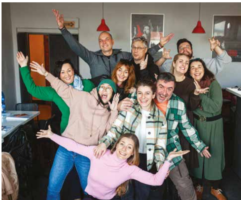
Realizační tým inscenace Zamilovaný velvyslanec.