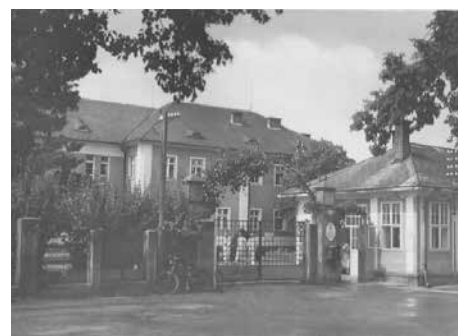
Vstupní brána v roce 1953.