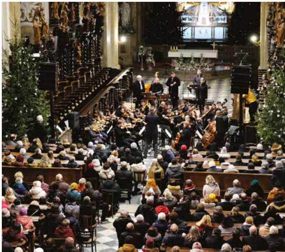
Adventní koncert ve františkánském kostele.

Co letos chystá hudební uskupení žáků a učitelů uměleckých škol?