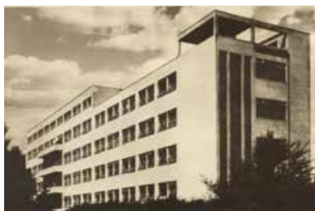
Moderní budova lidově zvaná „skleňák“ po roce 1937.