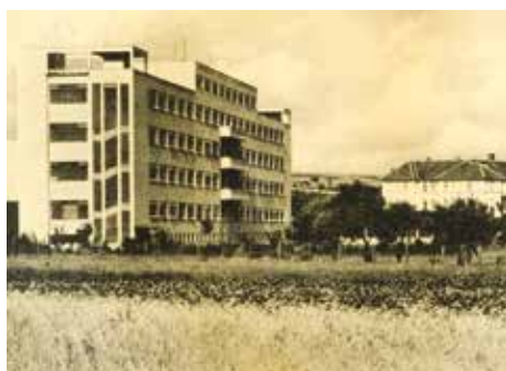
„Skleňák“ ve čtyřicátých letech.