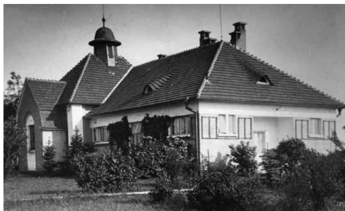
Nemocniční kaple a patologie v meziválečném období.