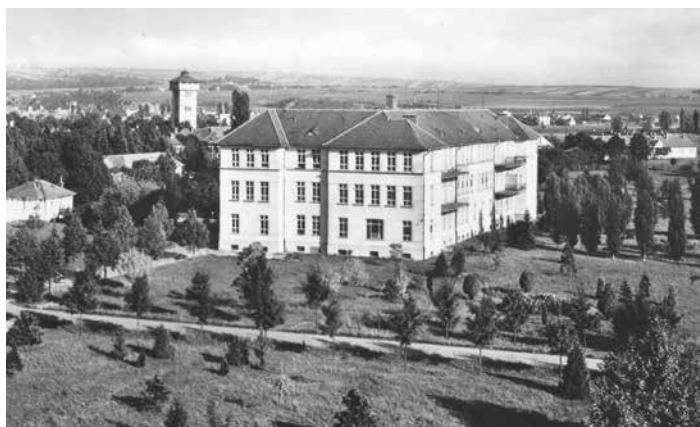
Budova interny v meziválečném období.