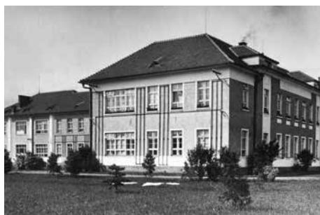
Pavilon chirurgie v roce 1930.