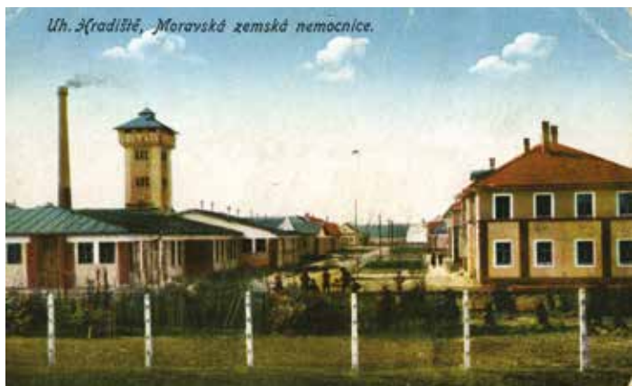
Pohled na areál nemocnice po roce 1924.

Otevřela 15. ledna 1924 a během půl roku přijala tři tisíce pacientů, brzy bylo třeba ji rozšířit