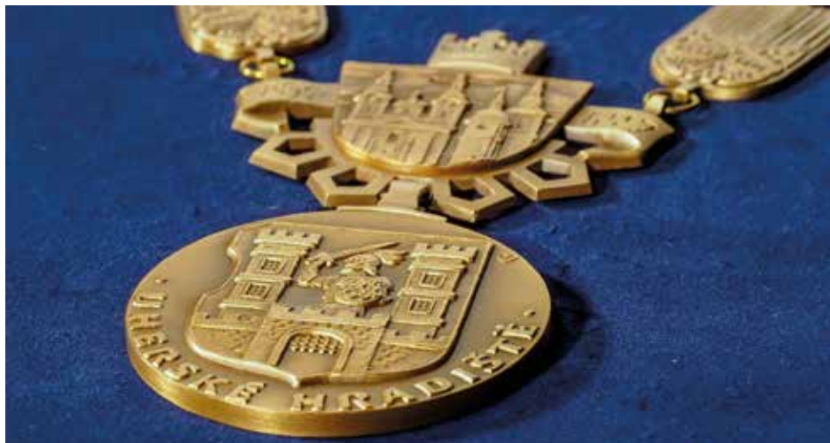
Symboly města na novém obřadním řetězu.

Dílo představuje řadu symbolů: centrální článek štítového tvaru, s reliéfem hlavních historických dominant města, nese na své horní straně korunu krále Přemysla Otakara II. Do obou stran pak vybíhá nápisová páska s několika staroslověnskými literami. Spodní část centrálního článku je obkroužena částí barokních hradeb připomínajících jednu z etap opevnění města. Řadový článek je inspirován takzvaným nákončím, charakteristickým detailem z výbavy velkomoravského oblečení.