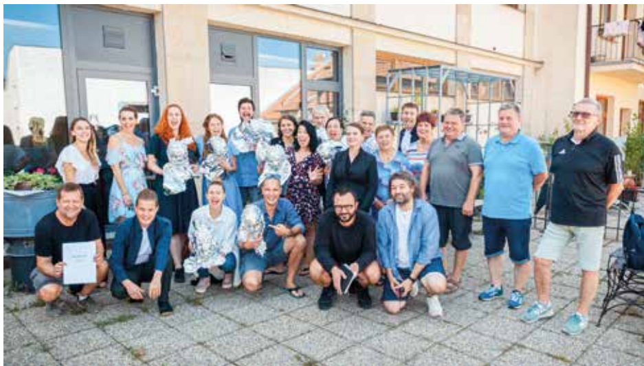
Láska, vzdor a smrt, zahajovací zkouška.

„Emil František Burian napsal spoustu hudby včetně šlágru Chlupatý kaktus , byl to tvůrčí a renesanční autor, ve své době velmi novátorský. Toto jeho dílo jsem ale neznal, a když jsem si ho poslechl, nesmírně mě zaujalo. Bylo to velké překvapení a říkal jsem si, to je krásné, to patří na jeviště Slováckého divadla, protože je to hudba, která čerpá z prvků lidové hudby a slovesnosti. To dílo koresponduje