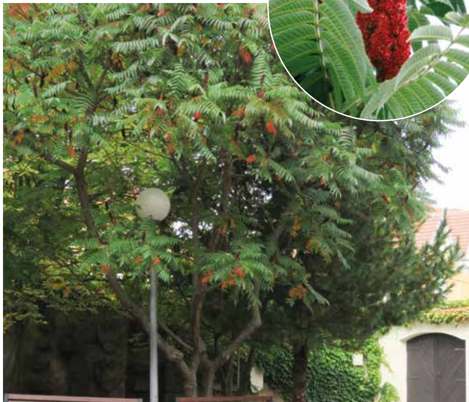
Škumpa na nádvoří Galerie Slovákého muzea.

Kvete během června a července. Květy jsou pětičetné, jednopohlavné a velmi drobné, měří jen 2 až 3 mm. Samčí kvítky mají žlutozelenou barvu a obsahují 5 tyčinek, v nichž vzniká pyl. Samičí květy jsou načernalé, uvnitř najdeme pestík s vajíčky. Opylení zajišťuje hmyz. Zvláště samičí květy produkují hodně nektaru, a tak jsou hojně navštěvovány včelami. Květy jsou seskupeny do květenství jménem lata. Tyto laticy mají protáhlý „palicovitý“ tvar. Jejich délka činí 10 až 20 cm. Škumpa je rostlinou dvoudomou, na jednom exempláři tedy rostou pouze laticy samčí, na druhém samičí.