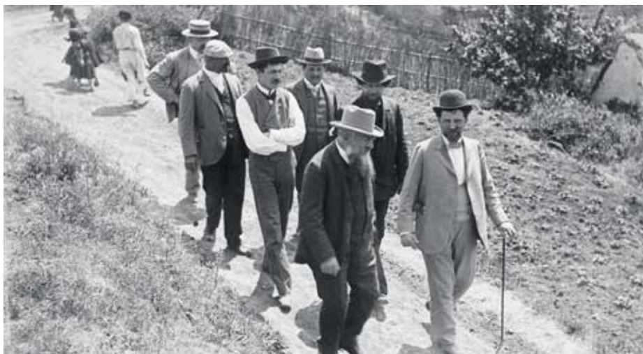
Proslulý sochař Auguste Rodin (vpředu se světlým kloboukem) s Alfonsem Muchou a dalšími umělci na Slovácku.

Slavný sochař Auguste Rodin na Slovácku v roce 1902