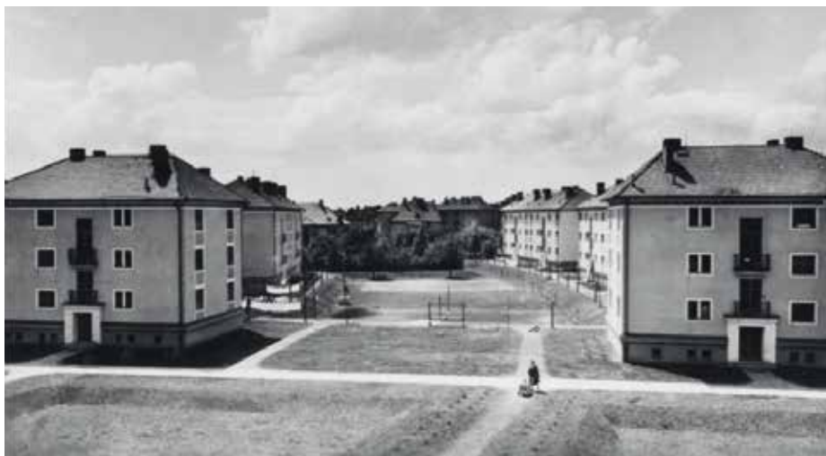
Sídliště Mojmír v roce 1957.

uherskohradištský závod Pozemních staveb Gottwaldov.