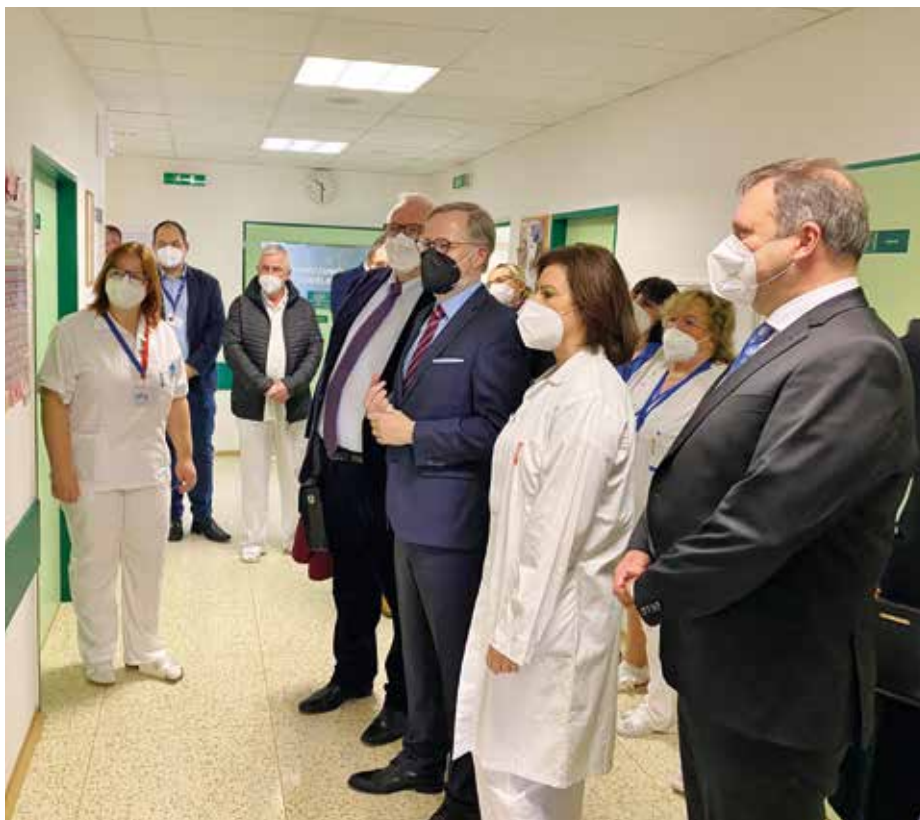
Premiér Petr Fiala v Uherskohradištské nemocnici.

10. ledna zavítal při své návštěvě moravských regionů do Uherskohradištské nemocnice, kam se přijel přesvědčit o připravenosti jedné z nejzatíženějších nemocnic v České republice na případnou další vlnu koronavirového onemocnění. Premiér se podíval také do komplexu bývalé věznice, která patří státu. Město usiluje o to, aby zde vedle umístění několika státních institucí vznikl Národní památník obětí totalitních režimů. Součástí programového prohlášení nové vlády je, že bude věnovat zvláštní pozornost institucím připomínajícím dějiny a oběti totalitních režimů 20. století, bude podporovat činnost paměťových institucí a podpoří přípravu klíčových projektů v této oblasti, jako je jmenovitě právě třeba věznice v Uherském Hradišti. Premiér v té souvislosti využil svou návštěvu města k tomu, aby osobně probral se zástupci Úřadu pro zastupování státu ve věcech majetkových postup prací při proměně tohoto komplexu.