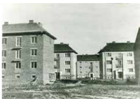
Výstavba domů na sídlišti, polovina 50. let.