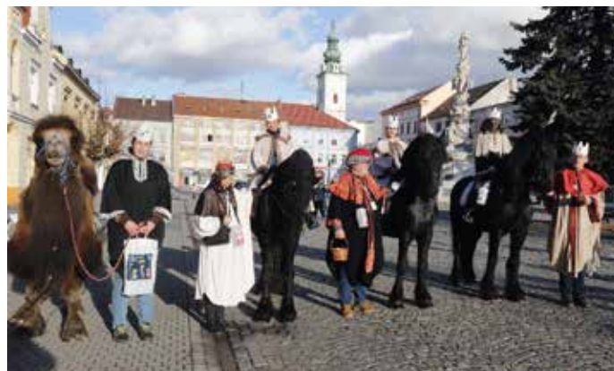
Tříkrálová obchůzka v centru Uherského Hradiště.

Trojice vraných koní provezla při letošním zahájení Tříkrálové sbírky Kašpara, Melichara a Baltazara spolu se zpívajícími lidmi v kostýmech a jejich doprovodem centrem Uherského Hradiště. Koledníci vyrazili z Mariánského náměstí, zastavili se