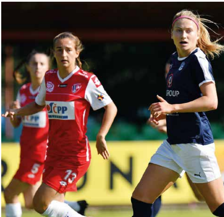
O mužském "áčku" Slovácka je sice víc slyšet, fotbalistky z Uherského Hradiště si ovšem v nejvyšší soutěži žen vedou ještě o něco lépe.

Hodnotí se účast a umístění sportovců v nejvyšších soutěžích, přeborech a pohárech, účast v reprezentaci, účast a umístění na olympijských hrách, mistrovství světa, mistrovství Evropy, účast a umístění ve světových a evropských pohárech. U trenérů soustavná práce s mládeží, budování pozitivního vztahu k danému sportu a pohybovým aktivitám obecně, dosažené sportovní výsledky v uplynulém roce s kolektivy nebo jednotlivci.