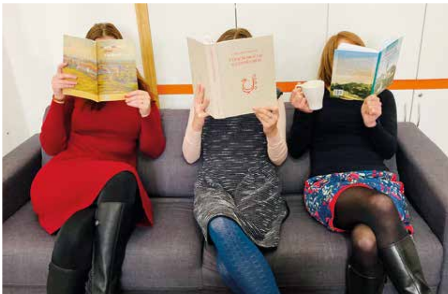
Knížky, které můžete koupit v hradištském „íčku“, vás zaujmou.

Kdo má rád Chřiby, neměl by si nechat ujít třetí část knihy Chřiby – po skalách a lomech od Bořka Žižlavského, určitě po jejím přečtení získáte tip na výlet do této vyhledávané lokality.