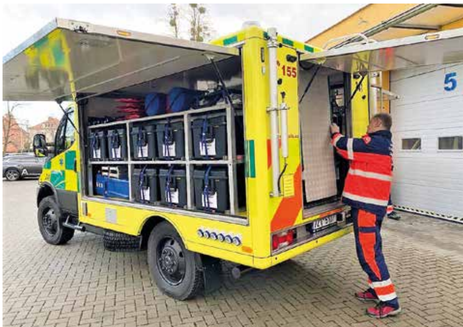
Speciální záchranný terénní vůz Iveco.

Nový speciální vůz Iveco Daily, primárně určený pro zásah u mimořádných událostí, jako jsou nehody autobusů či živelní katastrofy, převzali v polovině loňského prosince záchranáři v Uherském Hradišti. Automobil má v základní výbavě například vlastní zdroj elektrické energie, osvětlení či stan, který je možné i vytápět. Zdravotnickou záchrannou službu Zlínského kraje stálo auto více než 4,7 milionu korun. Pohon 4x4 zajišťuje vozu stabilitu i v těžko přístupném terénu. Automobil disponuje také navijákem. Jeho podvozek se ve stejném provedení vyrábí také pro armádní účely. Zdravotnická záchranná služba Zlínského kraje je jednou za základních složek Integrovaného záchranného systému a vedoucí lékař záchranky v oblasti Uherské Hradiště je také členem krizového štábu. „Vždycky říkám jedno – kéž nenastávají situace, při kterých je nutné tuto techniku využít. Na druhé straně vnímám jako vysoce potřebné, když je takto vyspělá technika k dispozici. O extrémní vytíženosti