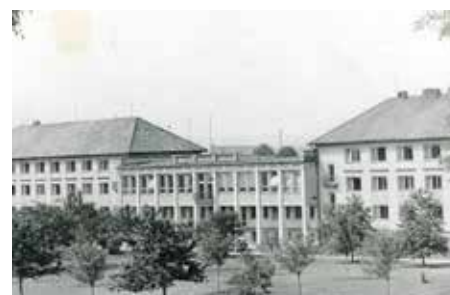
Domov průmyslové mládeže, druhá polovina 50. let.