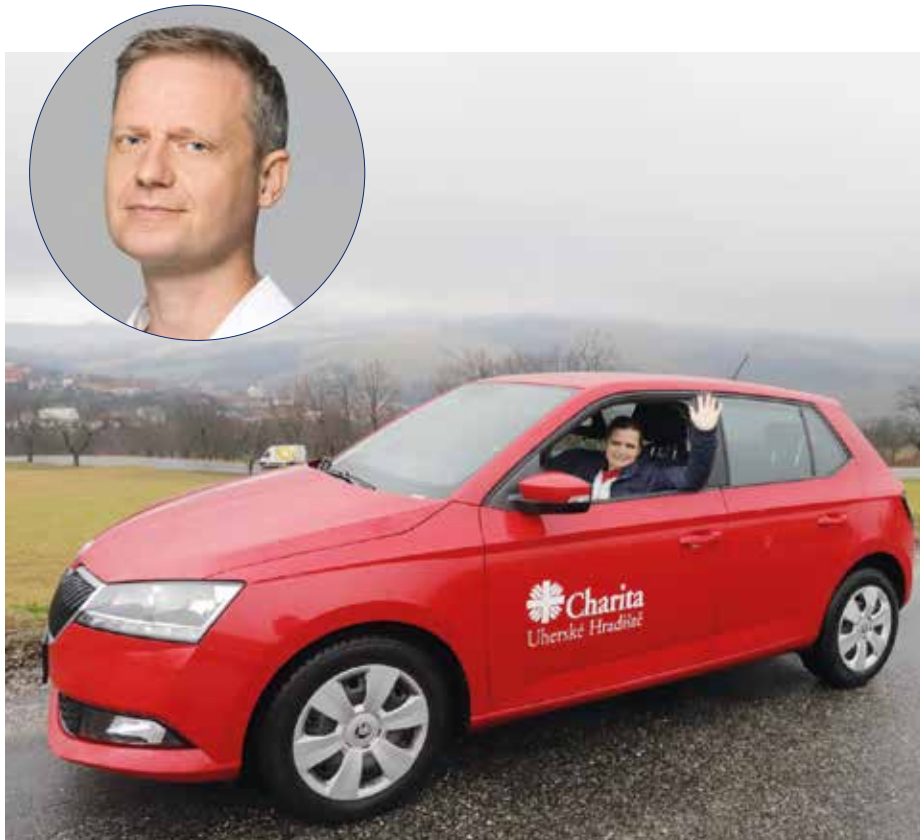
Domácí hospic Antonínek – stále na cestách po Uherskohradištsku.

Nabízíme mobilní specializovanou paliativní péči pro nemocné v závěru života, kteří se potýkají s nepříjemnými příznaky, například bolestí, dušností a dalšími těžkými stavy. Díky naší odborné podpoře a péči může nemocný zůstat doma i v případě, že jeho stav je z ošetrovatelského a medicínského hlediska nestabilní. Naši lékaři i zdravotní sestry jsou nemocným a jejich rodinám k dispozici čtyřicet hodin denně 365 dnů v roce. Zajistíme i potřebné pomůcky v podobě speciálních lůžek, přenosných toalet, antidekubitních pomůcek, v případě potřeby například i domácí kyslíkovou terapii nebo lineární dávkovač léků. Vše se odvíjí podle aktuálních potřeb nemocného. Snažíme se nemocným v závěru života