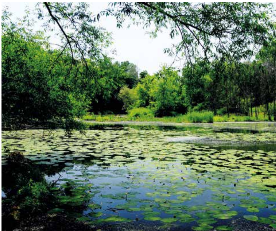
Slepé rameno Moravy zvané Kanada.

Rameno je dlouhé asi 1700 metrů a je rozděleno na tři části, trvale zavodněné jsou pouze dvě. V první o délce 900 metrů jsou bahnité usazeniny, místy, zvláště na mělčinách, je dno písčité s velmi bohatou vodní vegetací.