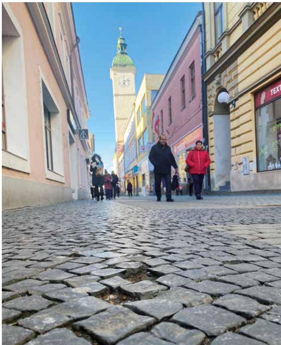
Dlažba v ulici Prostřední není v dobrém stavu a je třeba ji vyměnit.

Město předpokládá, že během stavby vznikne souběh samotné realizace se zásobováním a s přístupem k nemovitostem. „Realizace proběhne ve stísněném uličním