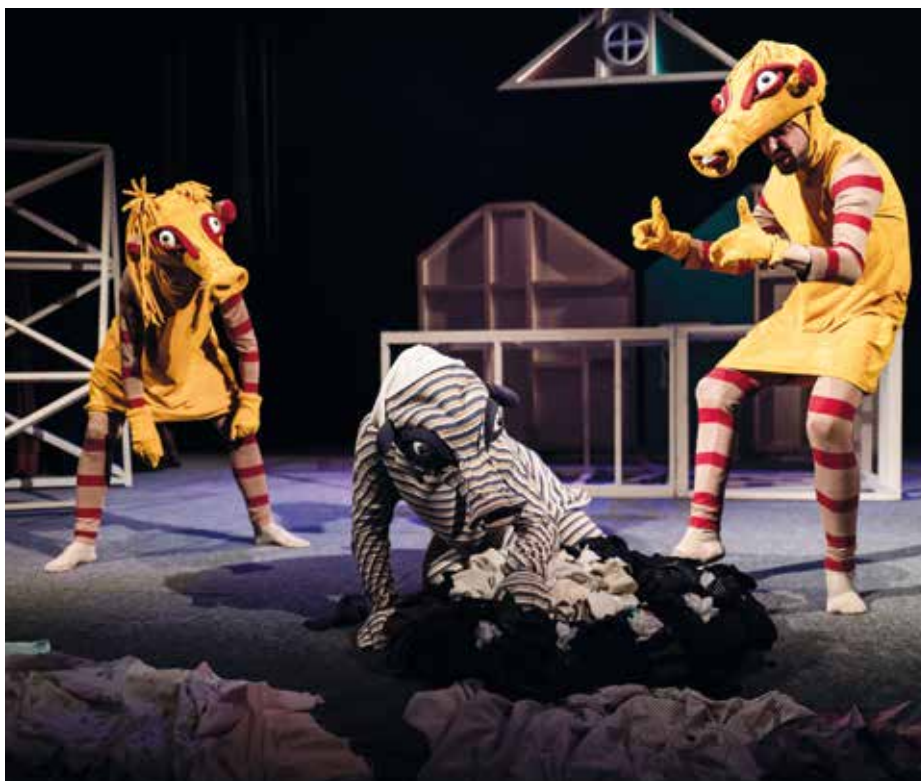
Lichožrouti na jevišti Slovákckého divadla.