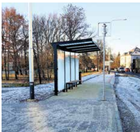
Nová zastávka u zimního stadionu.

Stavbu dvou protilehlých zastávek v blízkosti kruhové křižovatky na ulici Sokolovská dokončilo na samém konci loňského roku město Uherské