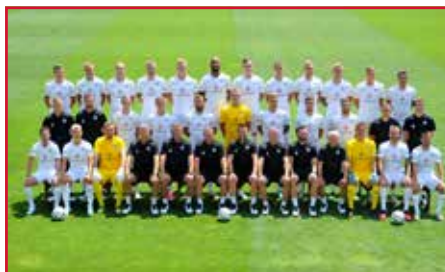
Fotbal - muži „A“ 1. FC Slovácko 4. místo v nejvyšší soutěži v sezóně 2020/21, navzdory covidu tým předváděl téměř po celou sezónu velmi kvalitní a atraktivní výkony, které stačily na historické umístění v nejvyšší soutěži a zajištění účasti v předkole Evropské konferenční ligy, tým překonal několik historických rekordů např. 9 utkání bez prohry v řadě, z čehož 8x zvítězil (od 20. 12. do 28. 2. 2021), 4. místo po podzimní části nejvyšší české soutěže 2021/22 a postup do čtvrtfinále poháru