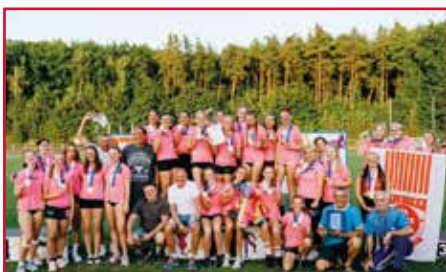
Atletika - dorostenky AC Slovácká Slavia Uh. Hradiště mistryně ČR v soutěži družstev - družstvo zvítězilo téměř o sto bodů. Cestou do finále absolvovalo družstvo dvě kola a na MMAŠ taktéž vítězně. V družstvu vždy nastoupilo 24 závodnic a z toho 6 hostujících. Ve finále tým doplnily nejlepší starší zážky.