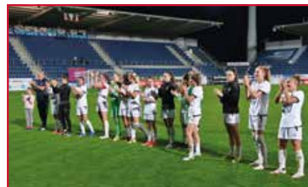
Fotbal - ženy 1. FC Slovácko 3. místo v nejvyšší soutěži žen, čímž si zajistily účast v kvalifikaci ženské Ligy mistrů, výsledky jsou skvělou vizitkou dlouhodobé práce Slovácka v rámci ženského fotbalu, kdy jejich hráčky nastupují za reprezentační výběry, 3. místo po podzimní části nejvyšší české soutěže 2021/22