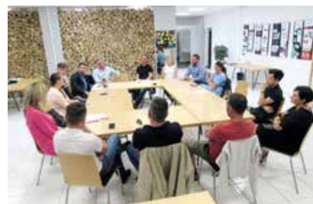
Inspirativní setkání v coworkingovém centru.

Více na www.hub123.cz nebo na e-mailu: vendula@hub123.cz . - HUB -