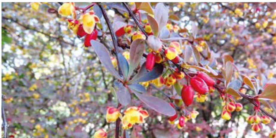
Květy a plody na keři dřišťálu.

Ke kvetení dochází v dubnu až květnu. Jemně vonící květy jsou zbarveny žlutě, mají průměr kolem 6 mm. Tvoří je šest lístků kališních, šest lístků korunních, vše je rozmístěno celkem ve čtyřech kruzích vždy po třech lístcích. Uvnitř květu vidíme tyčinky a pestík. Květy jsou přibližně po 15 seskupeny do květenství – dolů směřujícího hroznu. Opylení běžně zajišťuje hmyz, někdy však může v rámci jednoho květu nastat i samoopylení – autogamie. Po oplození vzniká plod – oválná sytě červená bobule. Má délku kolem 1 cm,