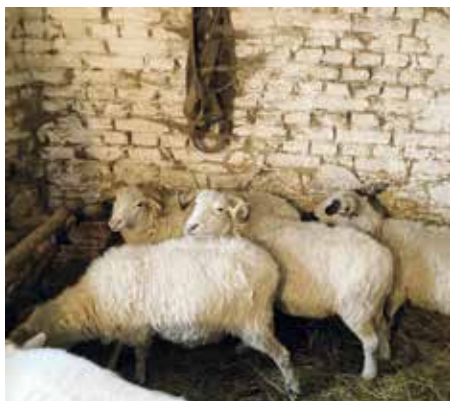
Ovečky z Beskyd si zvykají na Rochusu.