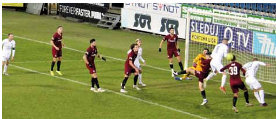
Jedna z mnoha nebezpečných situací před brankou Sparty.