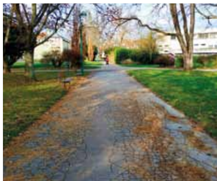
Chodník už volá po opravě.

Chodník protínající celý park Smetanovy sady chce město v první polovině roku opravit. Vyžádá si to skoro šest milionů korun. Město zrekonstruuje nejen celý páteří chodník, který začíná za budovou kina Mír a vede dál kolem Slováckého muzea a Slovácké budy až na ulici U Stadionu, ale rovněž zpevněný povrch oválu u altánu a zpevněné plochy u Slováckého muzea a u Slovácké budy. Součástí akce budou také práce na veřejném osvětlení, při kterých budou osazena tři nová svítidla. „Některé ko-