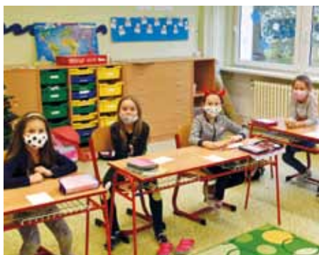
S rouškami a omezeními, ale naživo a společně.

Zamyšlení nad tím, co nám distanční výuka vzala a co naopak dala