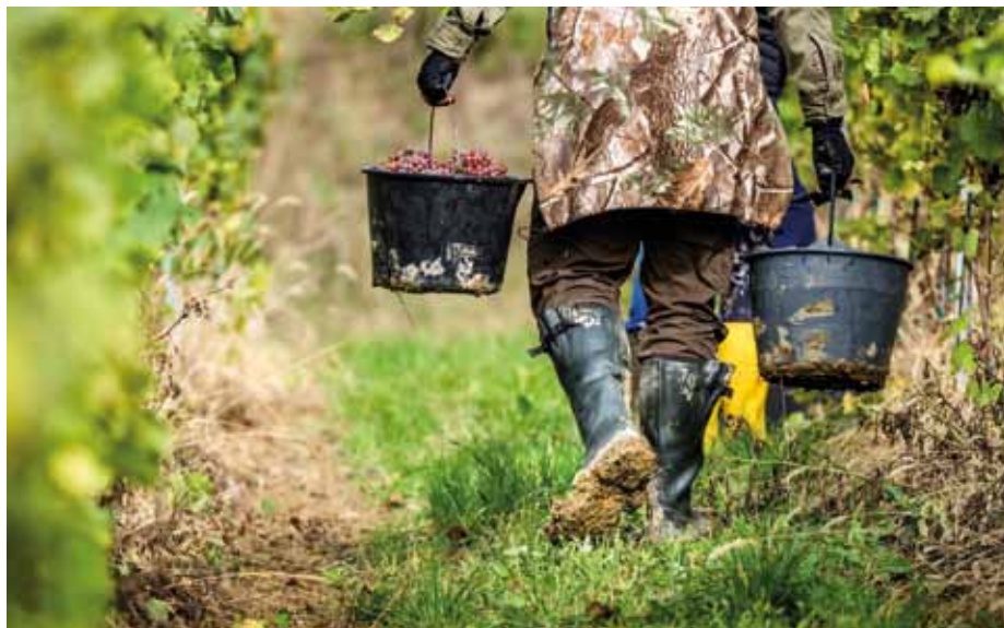
Holínky obalené bahnem se staly symbolem vinobraní 2020.

Hrozny měly kvůli deštům nižší cukernatost a více kyselin. „Zdravotní stav hroznů a jejich množství byly našťastí mnohem lepší, než co jsme vzhledem k deštům a s tím souvisejícím chorobám a plísním očekávali. Oproti roku 2019 jsou nižší cukry, ale zato úžasné kyseliny, které vínu dávají jiskrnost. Od ročníku 2020 lze tedy očekávat krásně aromatická a příjemně pitelná vína