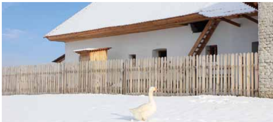
Zimní atmosféra u slováckého stavení ve skanzenu.

Pro školy jsme připravili bohatou nabídku výukových programů, v rámci kterých se dětem snažíme přiblížit život našich předků a jejich soužití s přírodou. Kulturní akce pro veřejnost budou tradičně zaměřeny na lidové zvyky a obyčeje, folklor, lidová řemesla, zemědělství i naši jedinečnou