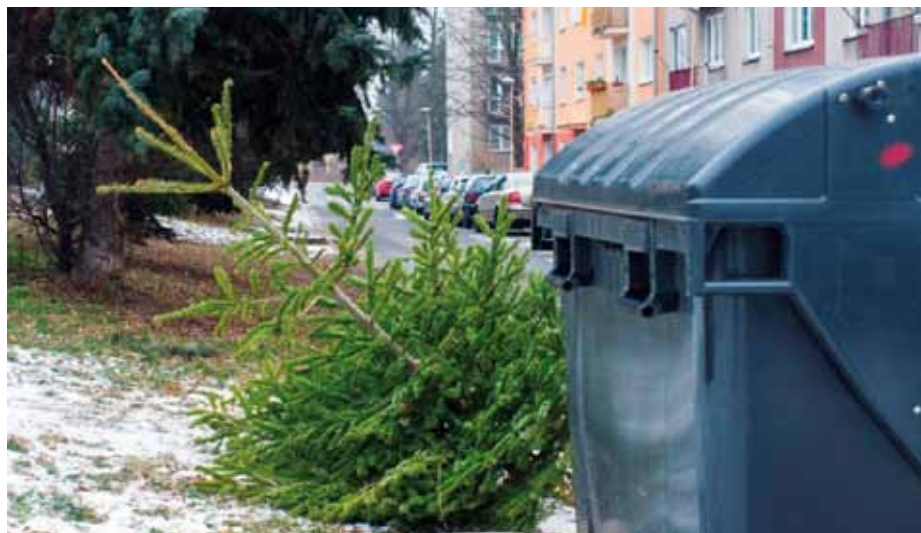
Stromek odložený u kontejneru.