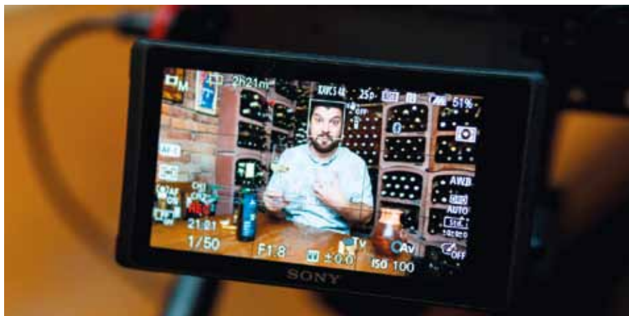
Novou zkušeností byly pro vinaře on-line degustace.

Přitom tyto aktivity příliš nepropagovali a nestihli ani vytvořit webovou prezentaci, všechny poptávky vznikly na základě osobních doporučení a dřívějších zkušeností ze zážitkových degustací ve sklepě. - PS -