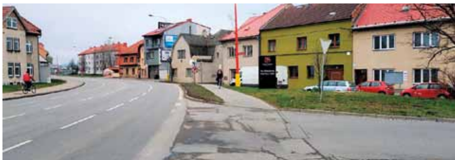
Současný stav křižovatky ulice Zervavice a Moravního nábřeží.