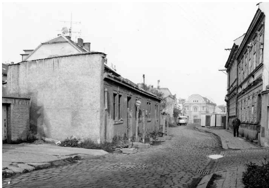
Pohled do Hradební ulice v 80. letech 20. století. Vpravo domy č. p. 227 a 242.