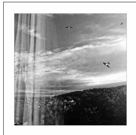
Snímek z cyklu Kde domov můj.