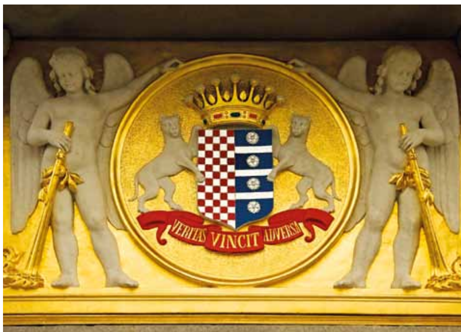
Restaurování mramorového reliéfu se dvěma anděly držícími rodový erb Pražáků vyžadovalo velkou řemeslnou zručnost.