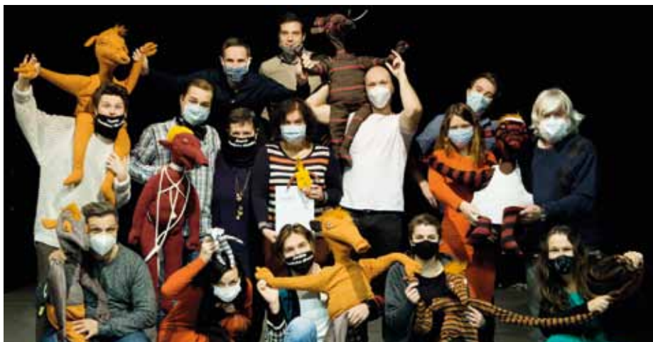
Herci a Lichožroti.