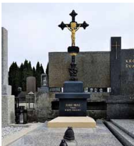
Válečné hroby na hřbitově v Mařaticích.