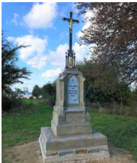
Opravený kříž u kaple na Rochusu.