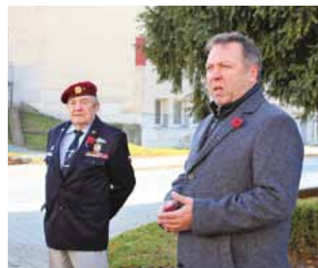
Setkání u pomníku na Komenského náměstí.