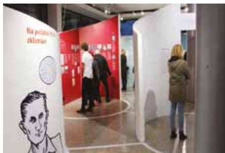
Výstava Případ Světlana ve foyer kina Hvězda.