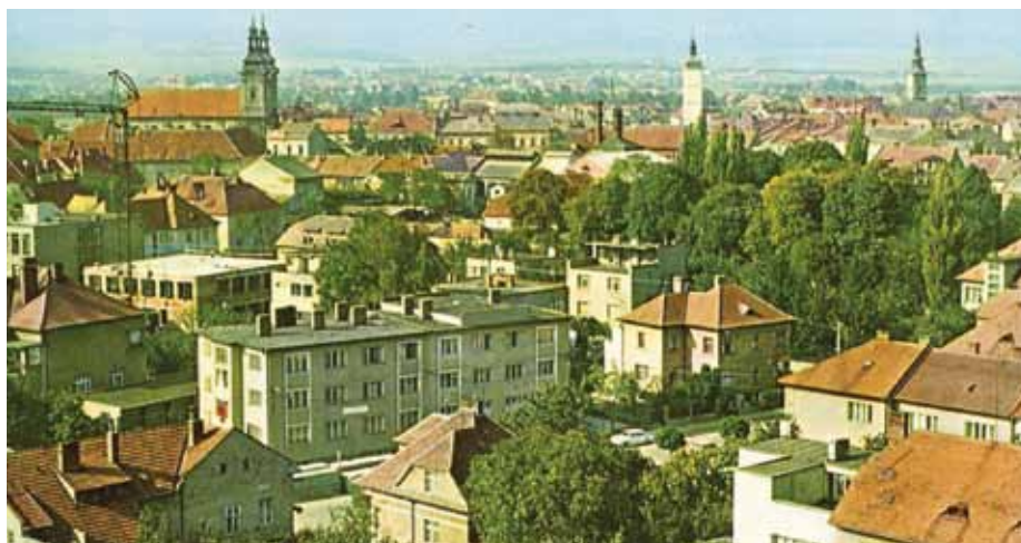
Pohled na Uherské Hradiště kolem roku 1960.

Na jižní straně města za železniční trať se během první republiky objevily rodinné vilky, především podle cesty k budované zemské nemocnici a v dnešní Husově ulici. Město tak výrazně překročilo hranice nejen