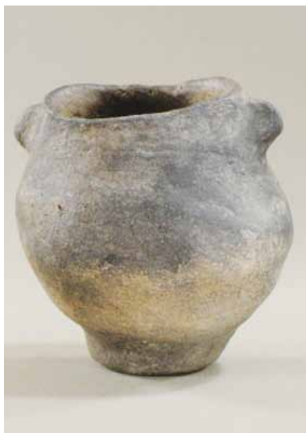
Amfora kultury se šňůrovou keramikou.

Ojedinelé stopy pobytu lidí však známe už z dřívějších dob. Ráz krajiny předurčoval místo k magickým praktikám. Sporadické starší nálezy pocházejí často z řečiště Moravy. Mezi nejstarší patří dno eneolitické nádoby staré asi pět tisíc let. Velmi staré jsou i amfora a kamenný sekeromlat lidu se