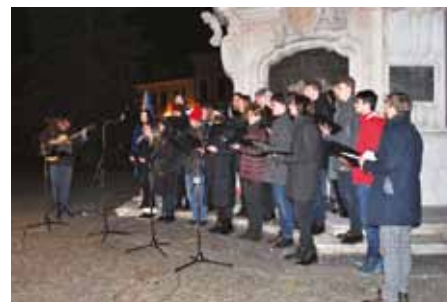
Tradiční zpívání na Mariánském náměstí.

Letošní oslavy 17. listopadu v Uherském Hradiště měly tři dějství. Vernisáží výstavy o odbojové protikomunistické organizaci Světlana, pietním aktem u pomníku obětem komunismu na Palackého náměstí a nakonec akcí Zpívání k 17. listopadu u Mariánského sloupu na stejnojmenném náměstí si Uherské Hradiště připomnělo 32. výročí vítězství svobody nad komunistickou diktaturou v roce 1989.