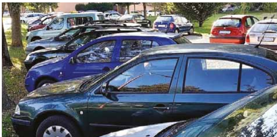
Parkoviště na sídlišti Štěpnice se postupně modernizují.