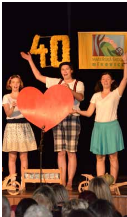
Čtyřicetiny školky v Míkovících.

Ve čtvrtek 14. října jsme v kulturním domě v Míkovících společně oslavili 40. výročí jejího otevření. Škola byla vždy součástí dění v Míkovících, a proto se do příprav zapojily všechny místní spolky. Program dětí ze školky obohatilo