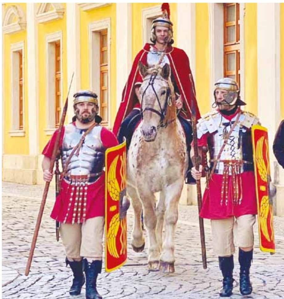
Svatý Martin s družinou přijíždí na náměstí.