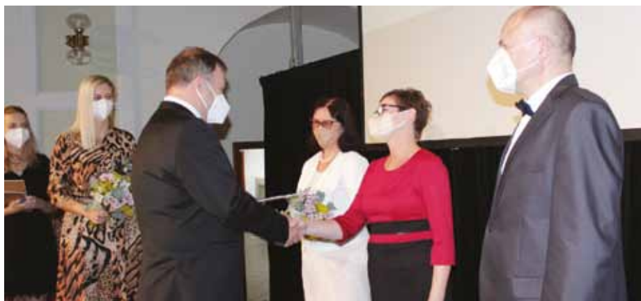
Starosta Stanislav Blaha předává v Redutě ceny výrazným pedagogickým osobnostem.

Odborná komise vybrala na základě doručených nominací celkem 21 pedagogických pracovníků. Ocenění byli jak pracovníci škol a školských zařízení zřízených městem Uherské Hradiště, tak i pedagogičtí pracovníci škol a školských zařízení ostatních