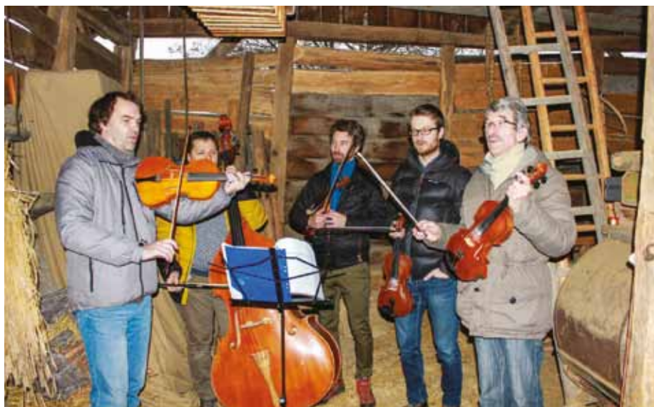
Na Štěpána zahraje hudecká sestava cimbálové muziky Burčáci.

Chvilí před Štědrým dnem se naladíme na pravou vánoční atmosféru. V sobotu 18. prosince od 13 do 16 hodin na akci Radostná novina zažijeme Vánoce tak, jak si je pamatují naše babičky a prababičky. Budeme pěst tradiční vánoční oplatky, odlévat olovo a zdobit vánoční stromeček.