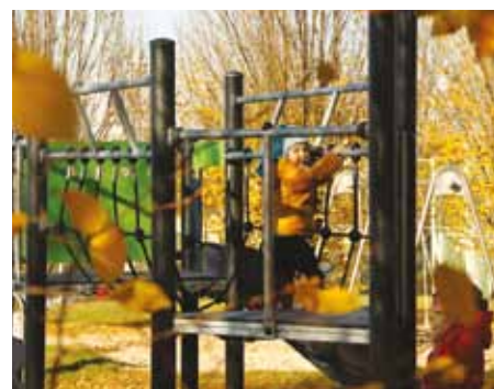
Hřiště na Hliníku.

měla proběhnout výměna houpačky za trojhoupačku s hnízdem. - JP -