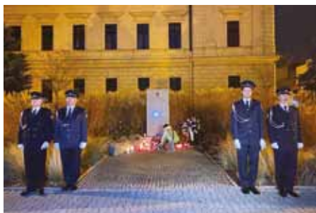
Pocta obětem komunismu na Palackého náměstí.

Výstava Případ Světlana v kině, pocta obětem totality i tradiční zpívání u „Rozárky“