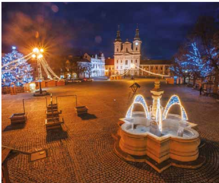
Na Masarykově náměstí budou světelnými řetězy vyzdobeny další dvě lípy.

Bez rozzářeného stromu na náměstí si Vánoce již neumíme představit. Na území Uherského Hradiště a jeho městských částí využívá město živých vánočních stromů, s jedinou