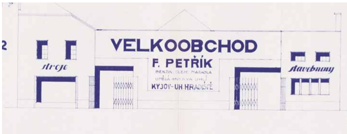
Nákres uličního průčelí obchodních prostor v č. p. 196.