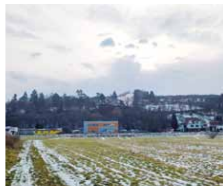
Dávni lovci na dnešním Jarošově oceňovali výhodnou polohu s dobrým rozhledem.