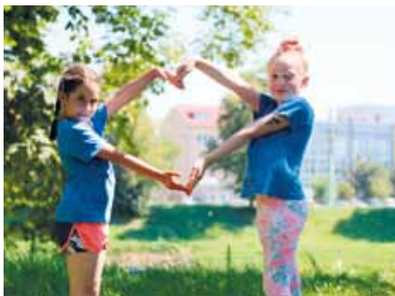
Léto u sokolovny.

Následující dva týdny ovládne sokolský areál gymnastika. V týdnu od 12. do 16. července proběhne pod