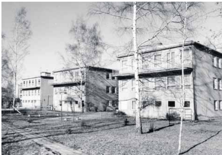
Areál školky v první polovině 70. let.

Mateřská škola Husova se otevřela dětem před 60 lety