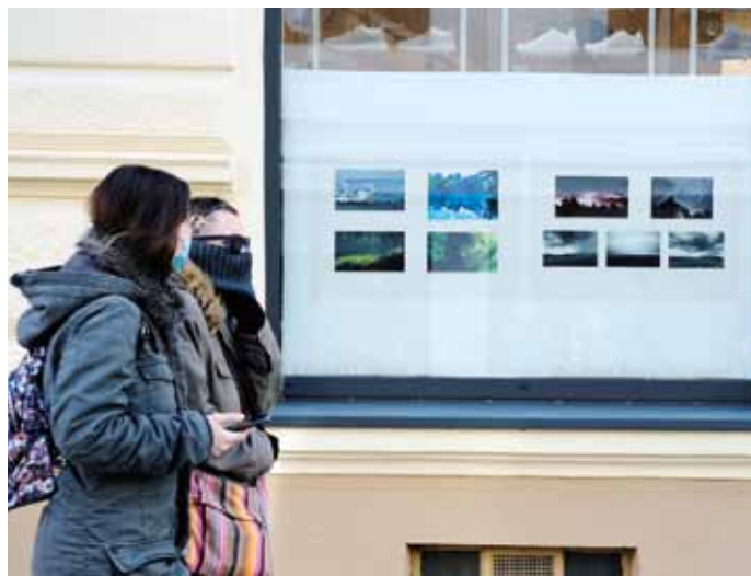
Ohlédnutí 2020 v ulicích města.