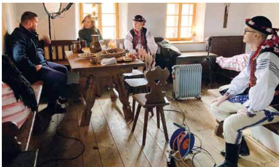
Babské rady ve skanzenu Rochus.