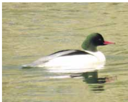
Morčák velký - samec.

Již několik let můžeme na řece Moravě pozorovat vzácnou zimní návštěvu. Od konce listopadu až do poloviny března u nás pobývá několik jedinců druhu morčák velký, kteří plují a přelétají od Jarošova po Kostelany.