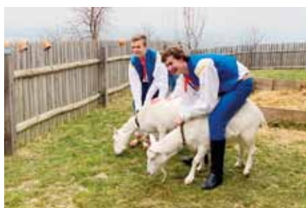
K práci ve skanzenu patří péče o zvířata.

Snažíme se, aby měli ke každému jednotlivci i ke skupinám návštěvníků