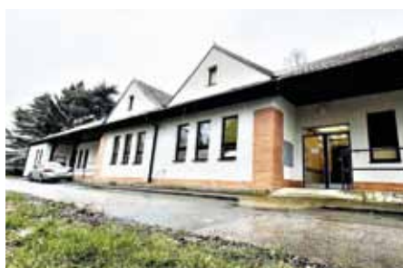
Očkovací centrum v Uherskohradištské nemocnici.

Chcete se nechat očkovat? Nejprve se musíte zaregistrovat na webovém portálu crs.uzis.cz . Registraci může provést také rodinný příslušník, praktický lékař nebo asistent na lince 1221. Konkrétní termín lze vybrat až ve chvíli, kdy na vybraném očkovacím místě budou dostupné vakcíny. Registrovaní o tom budou informováni prostřednictvím SMS.