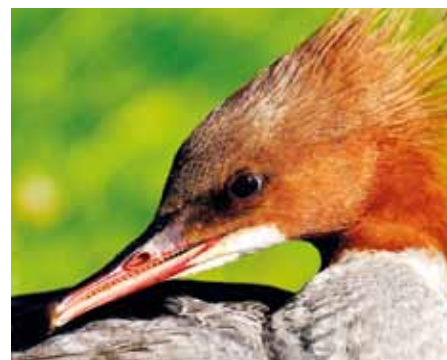
Morčák velký - samice.

K námluvám a páření dochází často už v průběhu února. V březnu si samice hledají místo pro hnízdění, využívají především dutiny stromů, běžně ve vzdálenosti i 400 metrů od řeky a ve výšce od 2,5 až do 18 metrů, méně často