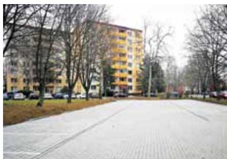
Nové parkoviště ve Štěpnicích.

Na konci roku 2020 byla dokončena první etapa rekonstrukce parkoviště na sídlišti Štěpnice. Parkovací plochu na ulici Zahradní o rozloze 1050 metrů čtverečních již město převedlo do plného užívání. Na parkovišti byl odstraněn nevyhovující nepropustný beton, který byl nahrazen kompletně novým povrchem včetně podkladních konstrukcí. „Plocha je nyní pokryta vysoce propustnou betonovou dlažbou a je koncipována tak, aby dešťová voda neodtékala do kanalizace, ale v celé ploše