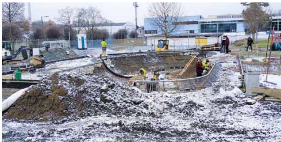
Nový skatepark vyrůstá v jižním cípu venkovního areálu aquaparku.

V červenci by město chtělo spustit zkušební provoz, který potrvá až do konce září. V případě nového skateparku, který vyrůstá v jižním cípu venkovního areálu aquaparku, nepůjde pouze o prostor pro jízdu na skateboardu, ale o multifunkční zařízení umožňující provozování dalších