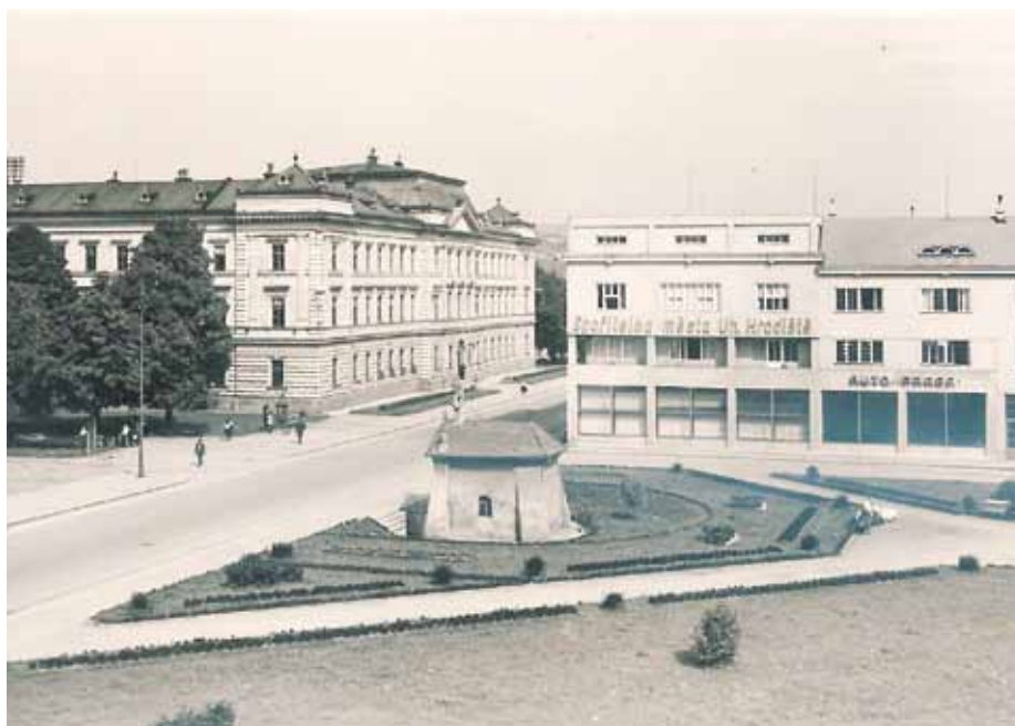
Východní strana Palackého náměstí v roce 1934.