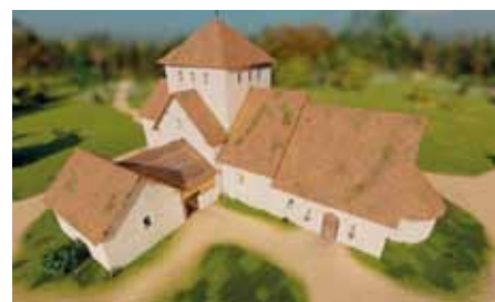
Vizualizace možné podoby kostela na výšině sv. Metoděje.