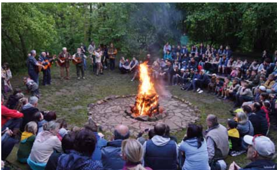
Vrcholem oslav bude společné setkání u slavnostního ohně.