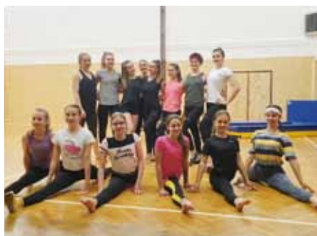
Po lockdownu opět v tělocvičně.

Těm, kteří už zahájili školní docházku, nabízí Sokol více možností. Všeestranné rekreační cvičení pokračuje v dívčích i chlapeckých