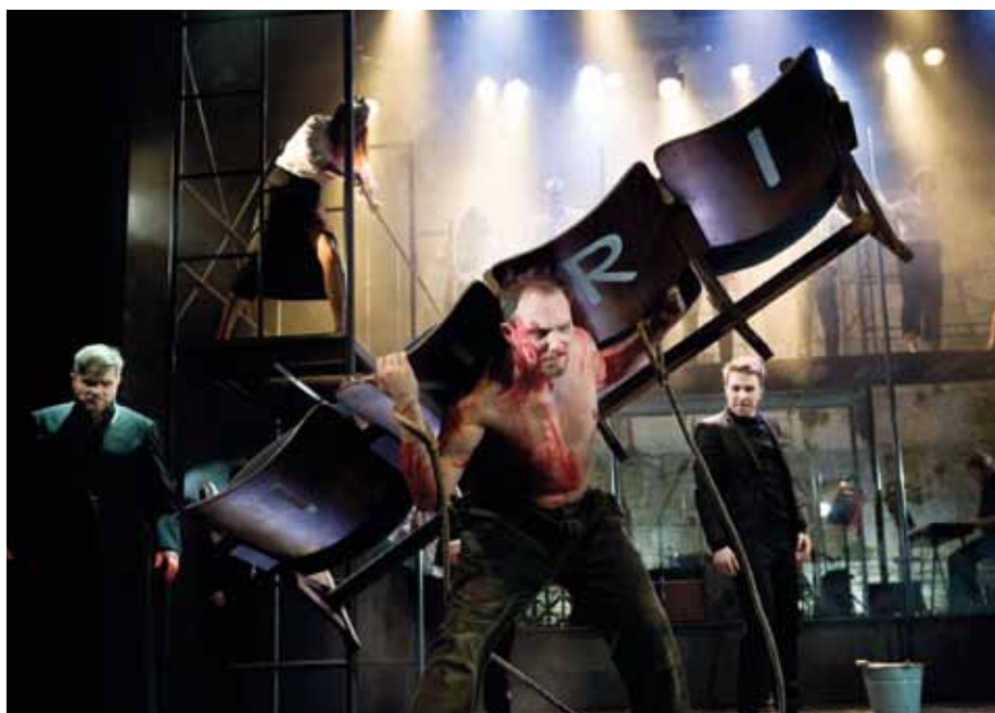
Muzikál Jesus Christ Superstar nabízí strhující podívanou.

Nekončící ovace ve stoje a desítky nadšených reakcí provázely začátkem července na nádvoří Reduty koncertní předpremiéru muzikálu Jesus Christ Superstar. Ten před rokem začal ve Slováckém divadle připravovat zkušený režisér Dodo Gombár. Po několika