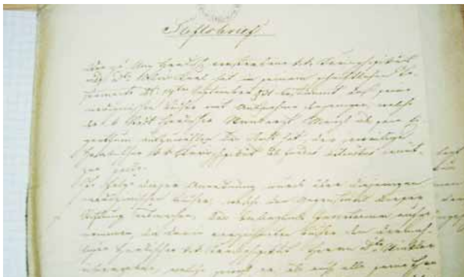
Zakládací listina knižního fondu lékařských knih pro krajské fyziky.