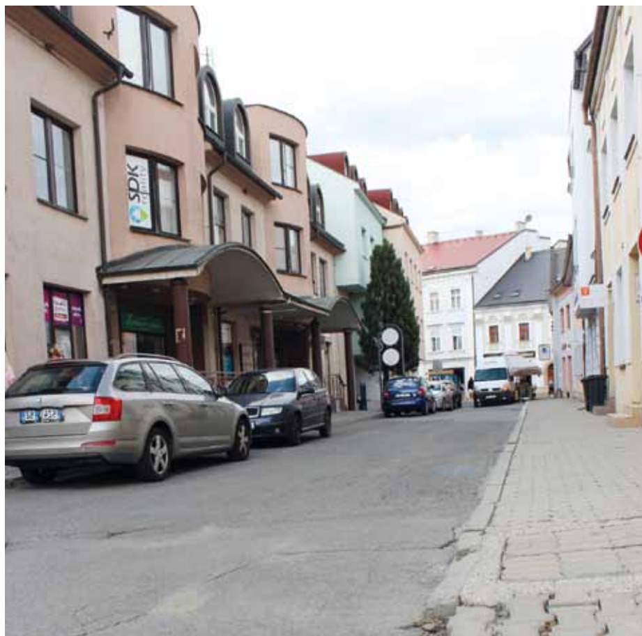
Revitalizace ulic v historickém centru pokračuje. Nyní je na řadě ulice Růžová.