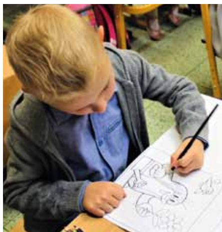
Školní rok začíná.

„Pro děti v mateřské škole a žáky prvního stupně chystáme aktivity v oblíbeném projektu Sporták. Děti mohou si vyzkoušet základy hokeje, gymnastiky, atletiky, tenisu a fotbalu, to vše prostřednictvím tandemové výuky, kdy děti a žáky vedou nejen učitelé, ale zejména známí sportovci a profesionální trenéři," informovala