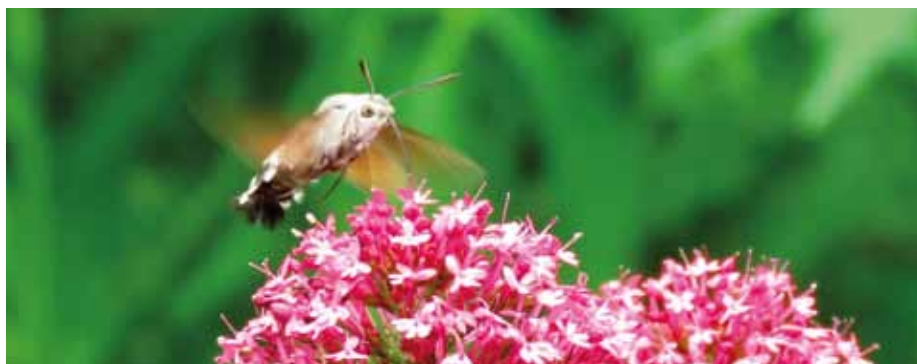
Dlouhozobka sající nektar mavuně.

K nesmírně zajímavým motýlům, které můžeme po celém Uherském Hradišti pozorovat od konce května do poloviny října, patří dlouhozobka svízelová, Macroglossum stellatarum . Její anglický název zní hummingbird moth, „kolibřík můra“. Způsobem letu kolibříka opravdu trochu připomíná. Jedná se o tažný druh řazený do čeledi lišajovití, který je však na rozdíl od většiny příbuzných aktivní ve dne. Pro vědecký svět jej popsal již roku 1758 Carl Linné.