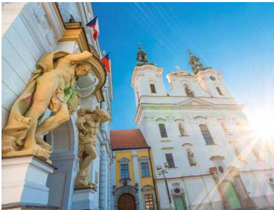
Během Dnů evropského dědictví bude zpřístupněno 23 památek.

V seznamu památek jsou i dvě trvale přístupné. První z nich je jediná uherskohradištská národní kulturní památka Výšina svatého Metoděje, druhou pak část městských hradeb za Klubem kultury, kde bylo při jejich obnově