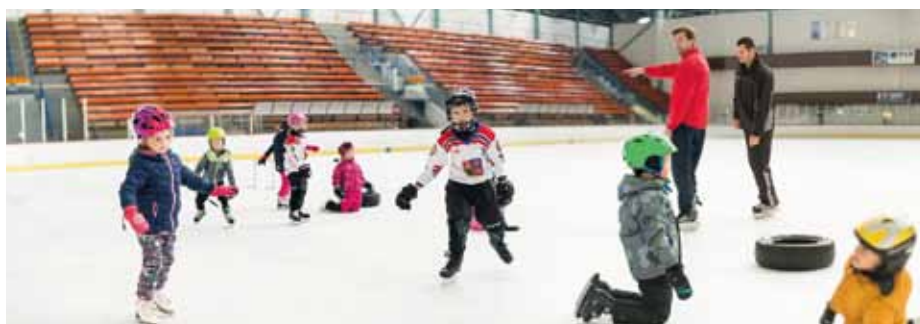
Děti se seznámí i se základy hokeje.

Děti za svými trenéry budou dojíždět na sportovní halu nebo zimní stadion. „Těšíme se na společně strávený čas a především doufáme v normální rok