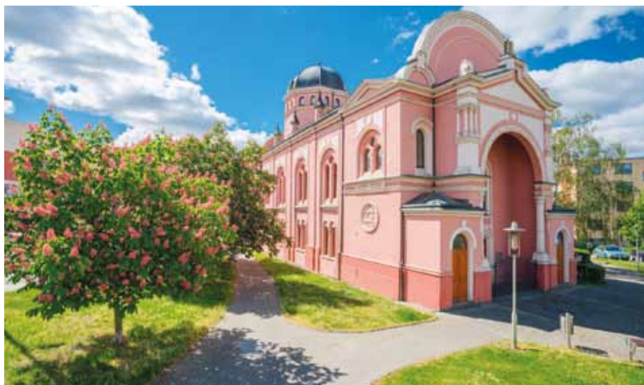
Současná podoba budovy uherskohradištské knihovny.

V roce 1948 došlo k významnému kroku v řešení prostorových potíží městských kulturních organizací. Byl vypracován plán přestavby bývalé židovské synagogy na kulturní dům, kde podle původně předloženého návrhu měla mít knihovna pouze jednu místnost, ostatní prostory by využívala Slovácká filharmonie a pěvecký sbor Svatopluk. Z prvního písemného záznamu z jednání o přestavbě synagogy, který je datován k 6. srpnu 1948, víme, že Bedřich Beneš Buchlovan rozporoval původní záměr, neboť jedna místnost pro knihovnu byla zcela nedostačující, argumentoval například i nutností samostatné čítárny. V průběhu dalších měsíců téhož roku se ujasňovala koncepce vnitřní úpravy interiérů a konečný návrh adaptace byl schválen 24. února 1949. Díky dohodě všech tří budoucích uživatelů byly prostory rozděleny následovně: veřejná knihovna získala pět místností v přízemí budovy, které sloužily jako čítárna, půjčovna pro dospělé, půjčovna pro mládež a dvě kanceláře, v prvním poschodí