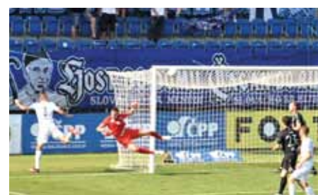
Jedna z mnoha příležitostí při utkání s Hradcem Králové.

Po srpnových zápasech v Jablonci a doma s Pardubicemi (po uzávěrce Zpravodaje) zajíždíme 11. září na Slavii, 18. září hostíme Zlín a 25. září hrajeme v Mladé Boleslavi. Snad se střelci proberou a body budou přibývat. - MP -