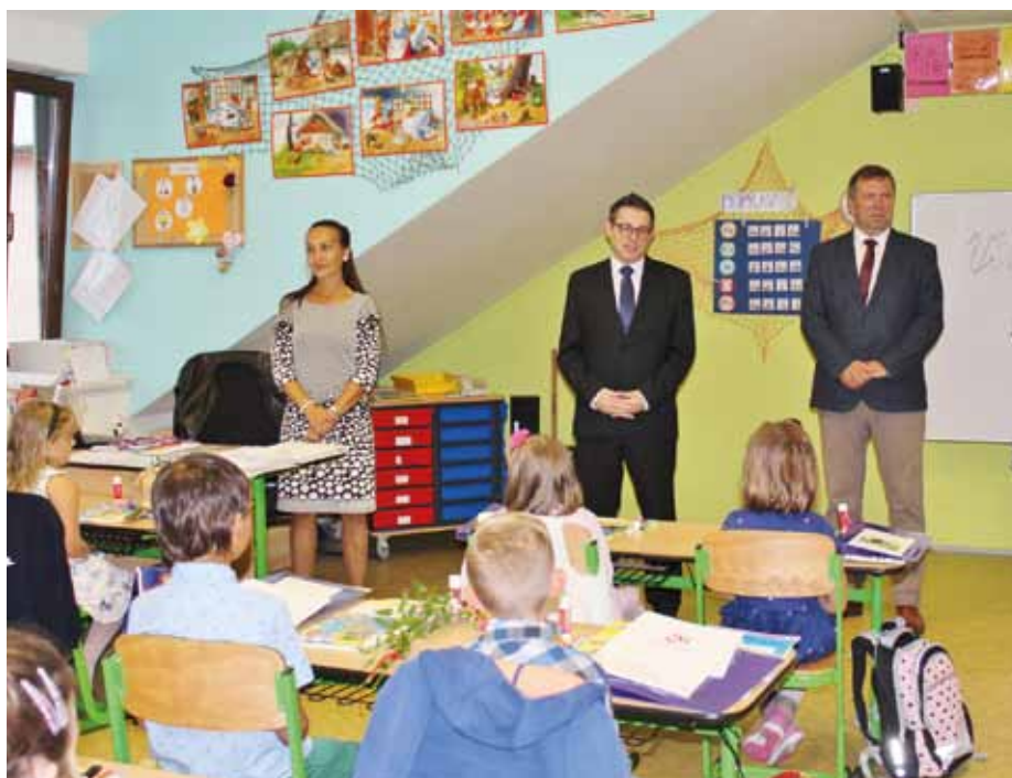
Tradiční vítání prvňáčků ve školách.

V Základní škole T. G. Masaryka v Mařaticích zlepšili o prázdninách prostředí školní jídelny, kde nechali vyměnit podlahu a vymalovat. Znovu vymalované jsou i společné prostory chodeb a některých kmenových učeben. „Pro žáky budoucích prvních tříd jsme během prázdnin zrekonstruovali