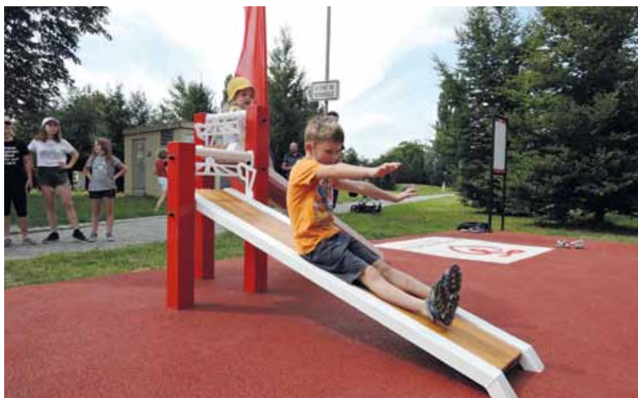
Slavnostní otevření nového hřiště.