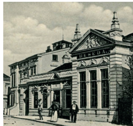
Měštanská beseda kolem roku 1900.