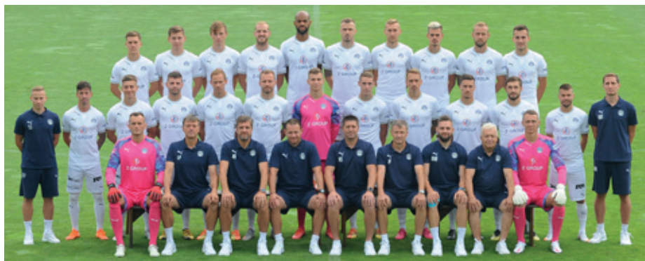
Tým 1. FC Slovácko v sezóně 2020/21.

V září po uzávěrci Zpravodaje odpadlo pohárové utkání ve Vyškově a mistrovské doma s Příbramí (obě kvůli koronaviru), a tak zůstal pouze 26. 9. výjezd na Slavii. Říjnové rozlosování se jeví