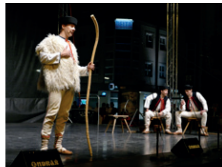
Vojenský umělecký soubor Ondráš.