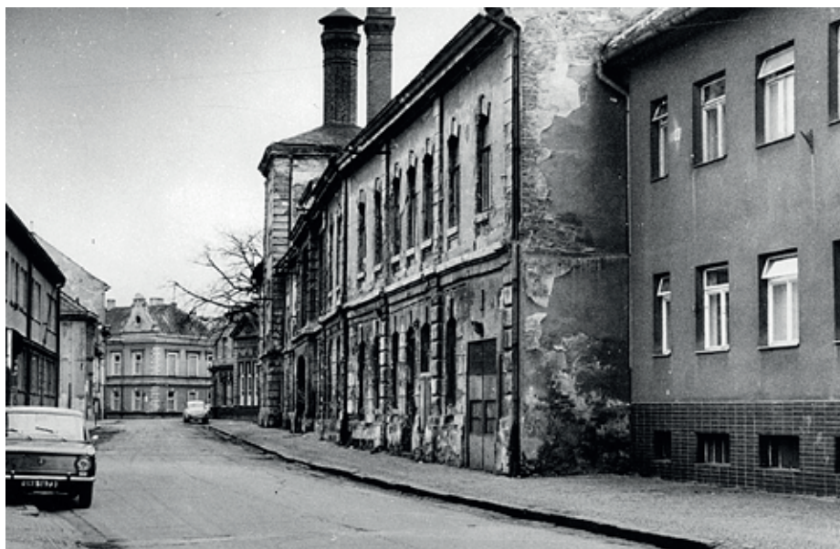
Měštanský pivovar před zbořením, vpravo dům č. p. 188.

Dodnes dochovaný bastion sv. František, nyní upravený jako park, byl po zrušení pevnosti podobně jako ostatní pevnostní území