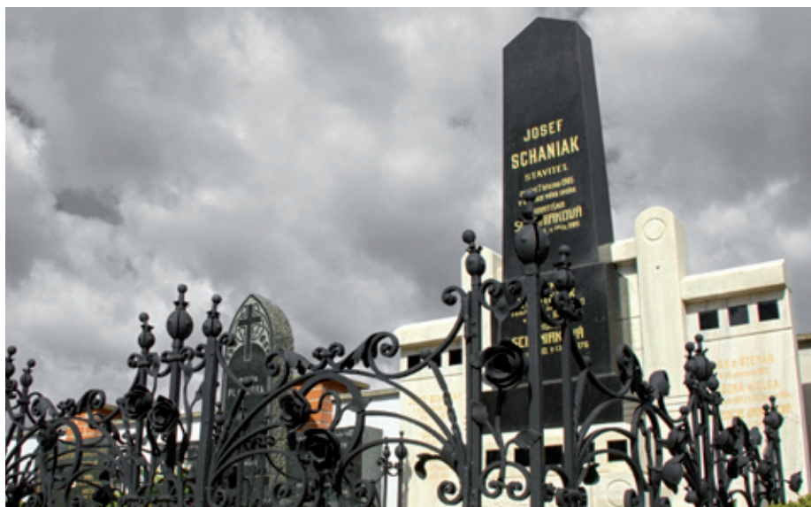
Hrobka rodiny Schaniakových na mařatickém hřbitově.