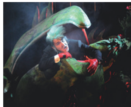
Adéla ještě nevečeřela a Jiří Hejzman.

„Věříme, že své příznivce zlatým fondem potěšíme. I my moc rádi vzpomínáme na inscenace, které už nehrajeme a byly pro nás výjimečné. Přesto se nejvíc těšíme, až se budeme moct s diváky pravidelně potkávat ve Slováckém divadle osobně,“ říká mluvčí divadla Josef Kubáník. - PK -