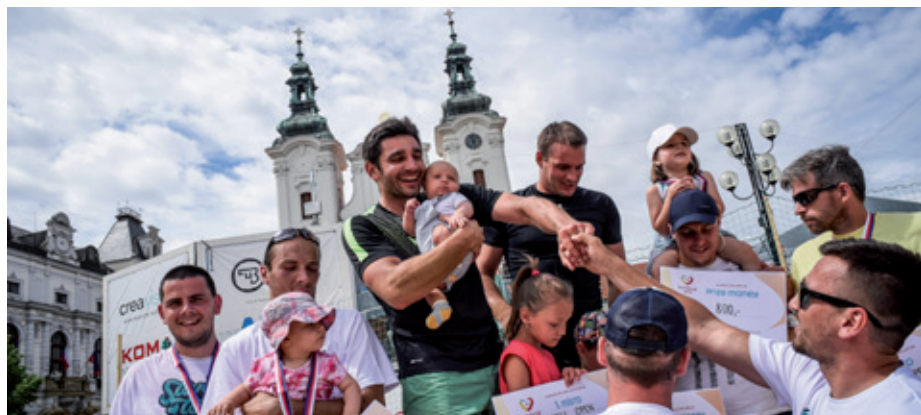
Velké akce na náměstí letos během Slováckého léta nebudou.

Návštěvníci se mohou těšit na sport i kulturní program