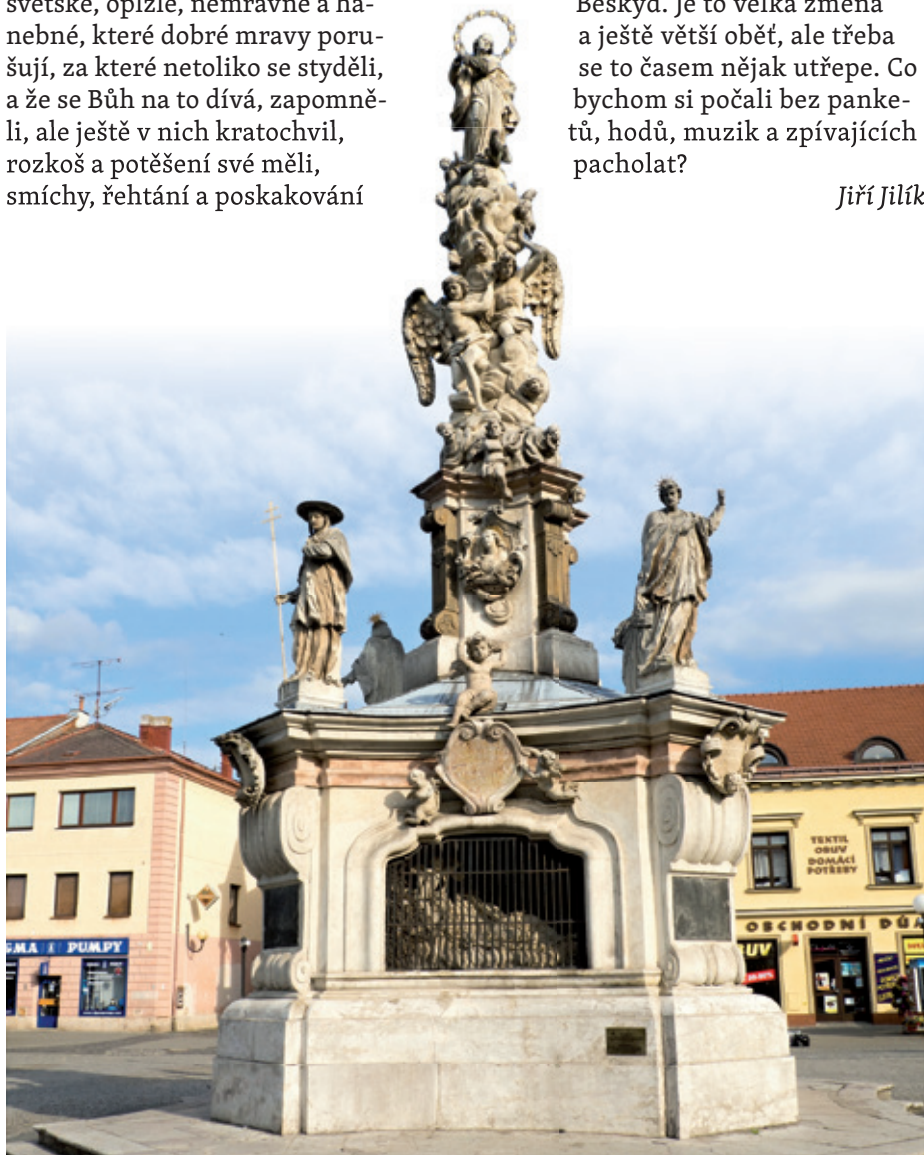
Epidemie nás provázejí dějinami. Připomíná to i morový sloup na Mariánském náměstí, který vytvořil v letech 1718 až 1721 sochař Antonín Riga.