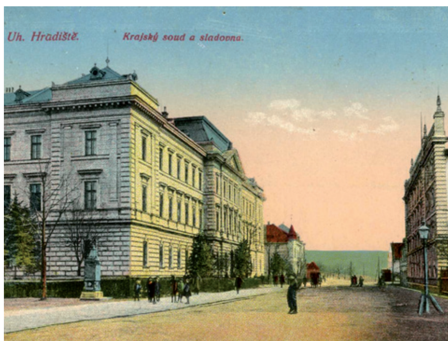
Fürstova sladovna na pohlednici z počátku druhého desetiletí 20. století.