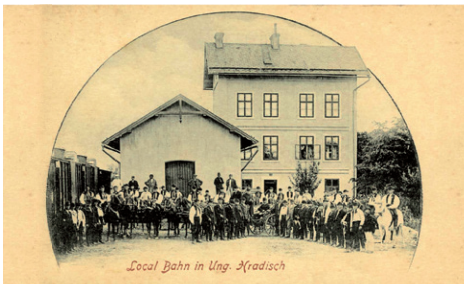
Stará nádražní budova na počátku 20. století.

V místech dnešní tržnice a při ní vedoucí ulice Na Stavidle až k nádraží