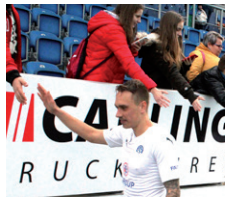
Děkovačky s diváky zatím nebudou.

V červnu se ještě budou hrát tři kola nadstavby (20.–21. června, 23.–24. června a 27.–28. června). To vše, pochopitelně, jen za optimální situace. Hráčům Slovácka a příznivcům přejeme hodně zdraví! - MP -