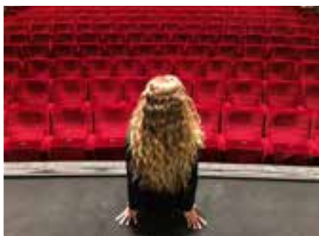
Hlediště Slovákého divadla osiřelo. Kdy se znovu naplní, není jasné.

Ve čtvrtek 12. března nejprve Slováké divadlo zrušilo až do odvolání všechna představení, v pondělí 16. března po poradě vedení přišla další zpráva – divadlo kompletně přerušuje svou činnost, nehraje a už ani nezkouší dvě připravované