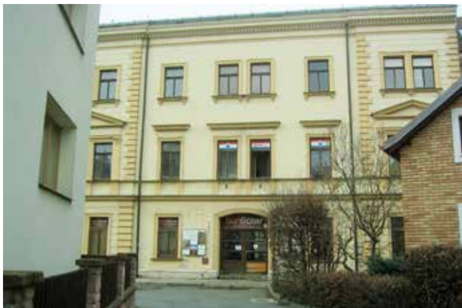
Pohled na dům č. p. 180 ze Sloupského ulice.