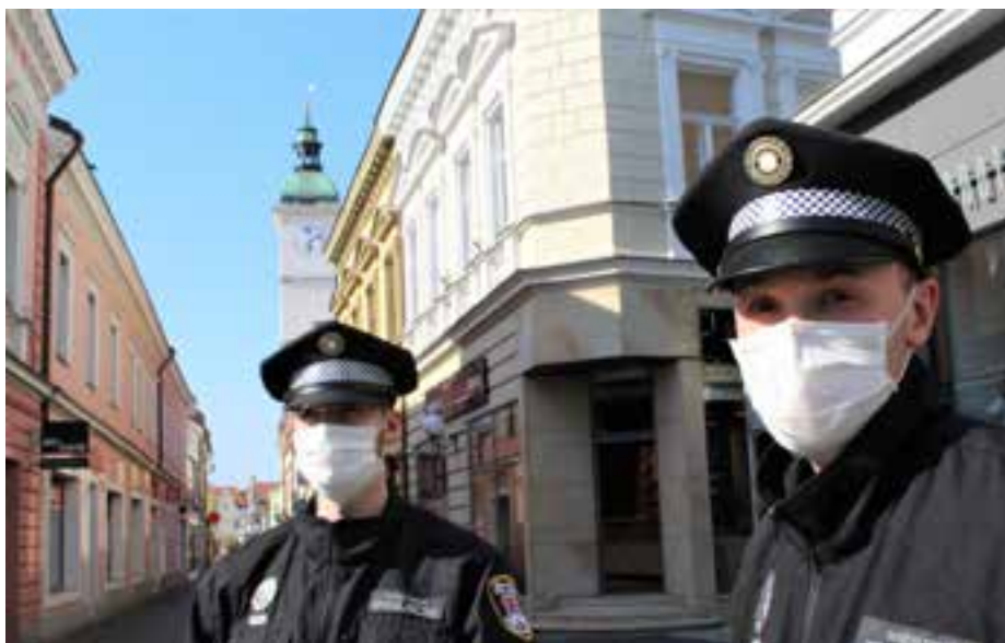
Strážníci s rouškami hlídající v centru města.