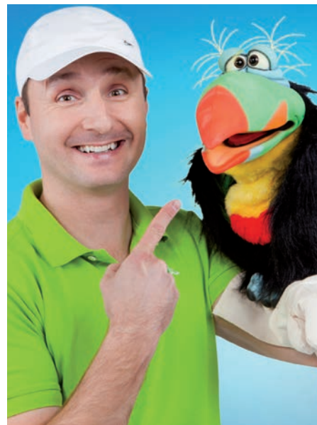
Kouzelný karneval, neděle 26. ledna v 15.00 hodin.

Naše zahrada byla 14. listopadu 2019 oceněna na Konferenci environmentálního vzdělávání a osvěty ve Zlínském kraji jako příklad dobré praxe podpory