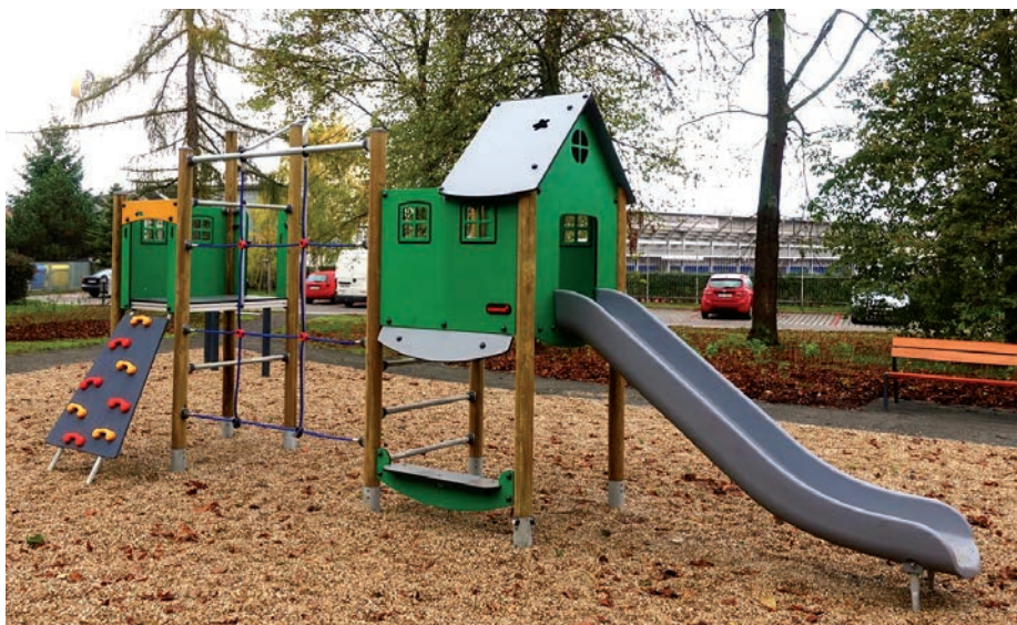
Opravené hřiště na sídlišti 28. října.

Město dokončilo druhou etapu regenerace sídliště 28. října. Stavební práce za 16,4 milionů spočívaly zejména v revitalizaci prostranství mezi panelovými domy a v rekonstrukci uličního prostoru. Modernizací prošel i původní dětský koutek.