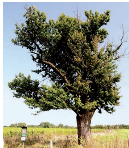
Oskeruše v původním stavu.