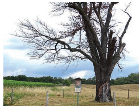
Oskeruše poté, co uschla.

postupně se rozpadajícího mateřského stromu mohl spokojeně odrůstat jeho potomek, který bude po další staletí dotvářet malebný krajinný ráz zdejší lokality a přinášet radost obyvatelům Mařatic i celého Uherského Hradiště. Tak jako tomu bylo dříve u památné Mařatické oskeruše.