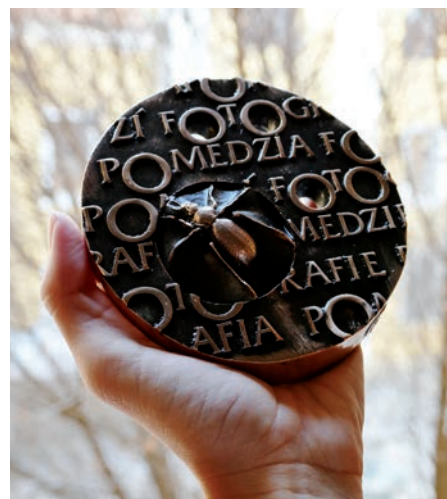
Ceny pro mezinárodní fotografickou soutěž Fotografie pomezí / Fotografie pomezia pořádanou Klubem kultury a TNOS Trenčín z dílny D. Trubače.

Na Slovácké bůdě je tabulka, kde je zachycena hladina vody při povodni