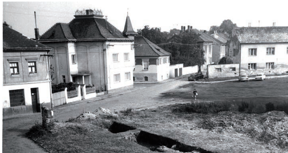
Část Dlouhé ulice v roce 1981.