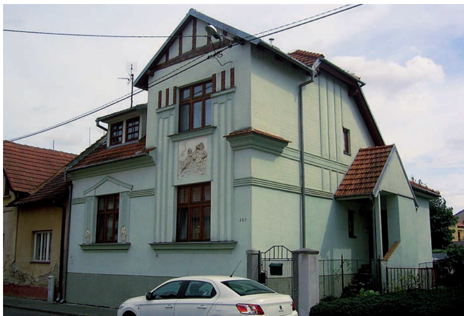
Dům č. p. 357 v Jiráskově ulici.