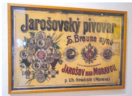
Dobová reklama z časů, kdy byl Jarošov dodavatelem piva na vídeňský císařský dvůr.

Atletické Mistrovství České republiky družstev mužů a žen hostí na konci srpna Uherské Hradiště. Mistrovství odstartuje v sobotu 25. srpna v 17.30, kdy se uskuteční soutěž mužů a žen v hodu kladivem. Všechny ostatní disciplíny jsou na programu v neděli 26. srpna. Začátek nedělního programu je v 10.30.