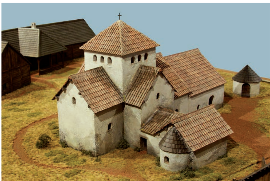
Model sakrálního centra v Sadech v době Metodějova arcibiskupství.