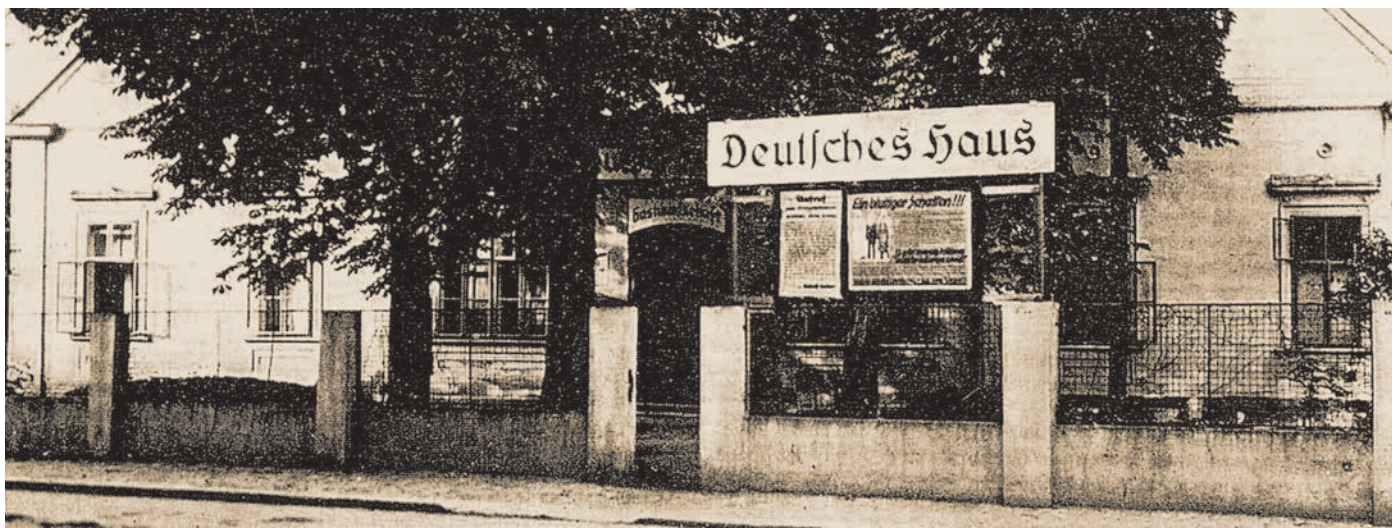
Budova někdejšího spolku Německé kasino v době protektorátu.