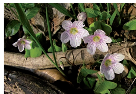
Jednou z typických bylin v Kunovském lese je šťavel kyselý.