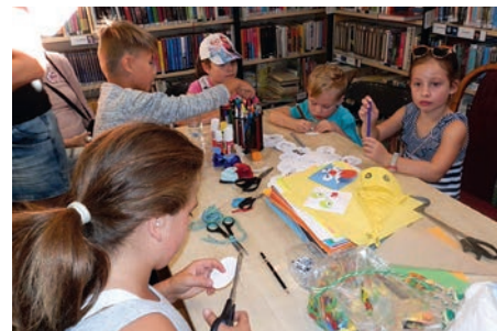
Prázdninové tvoření v loňském roce.

Svaz českých bibliofilů vydal u příležitosti 110. výročí své existence skvostně graficky vypravenou knihu Bedřicha Beneše Buchlovana Zajatec Armidy aneb Má přemilá krasopaní Knihoslava.