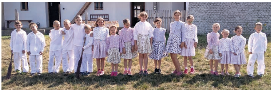
O prázdninách hostí skanzen Rochus oblíbený dětský příměstský tábor.

Do bohaté kulturní nabídky města i regionu se snažíme přispívat akcemi zaměřenými na tradice a lidovou kulturu. Programy navazují na obyčejový a hospodářský rok. Můžete u nás postupně poznat a prožít masopustní zvyky a slováckou zabíjačku, Velikonoce, stavění máje, sklizeň a zpracování úrody, dožínkovou slavnost, pouť, tradice spojené s vinobráním a zpracováním vína, na konci roku pak programy přibližující adventní a vánoční zvyky. Velmi oblíbený je i Slovácký festival