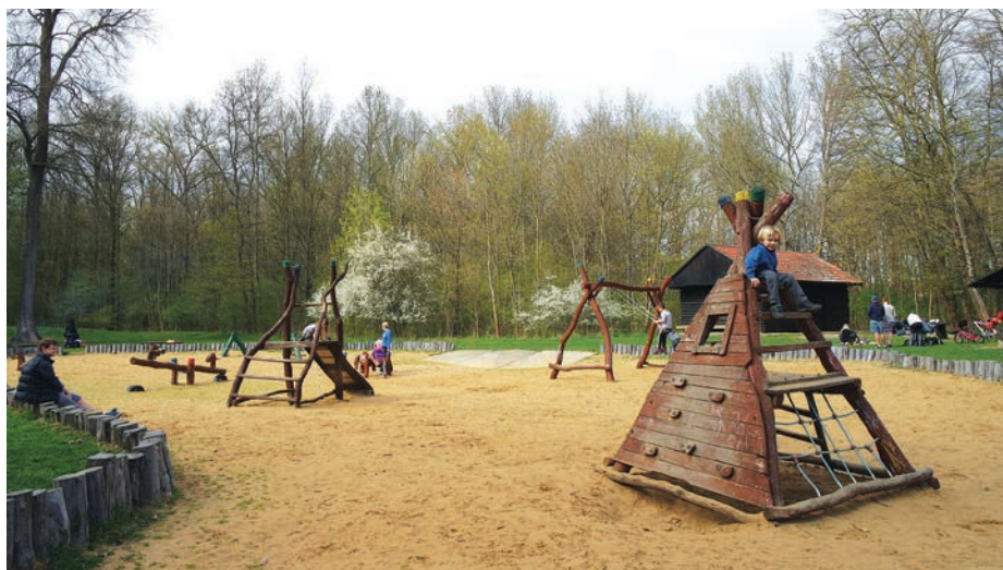
Dětské hřiště v lesoparku Kunovský les.