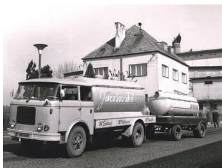
Jarošovský pivovar - 70. léta 20. století

Tak to už si opravdu nevzpomínám. Vždyť jsem se narodil v pivovaru a byl jsem pivem odkojený!