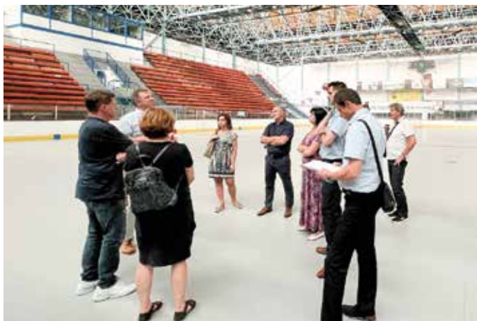
Jednání rady na zimním stadionu.

Město se zabývá také stavbou nového zimního stadionu. Aktuální stav střešní konstrukce je již nevyhovující a její výměna by z pohledu nákladů na rekonstrukci nebyla efektivní. Výstavbu nového stadionu však chce město ještě přehodnotit, a to vzhledem k nárůstu odhadovaných nákladů až na 300 milionů korun. „Celou věc znovu