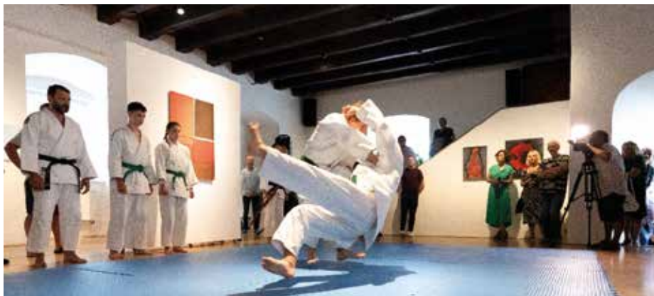
Vystoupení judistů na červencové vernisáži výstavy Sport ve výtvarném umění v Galerii Slováckého muzea.