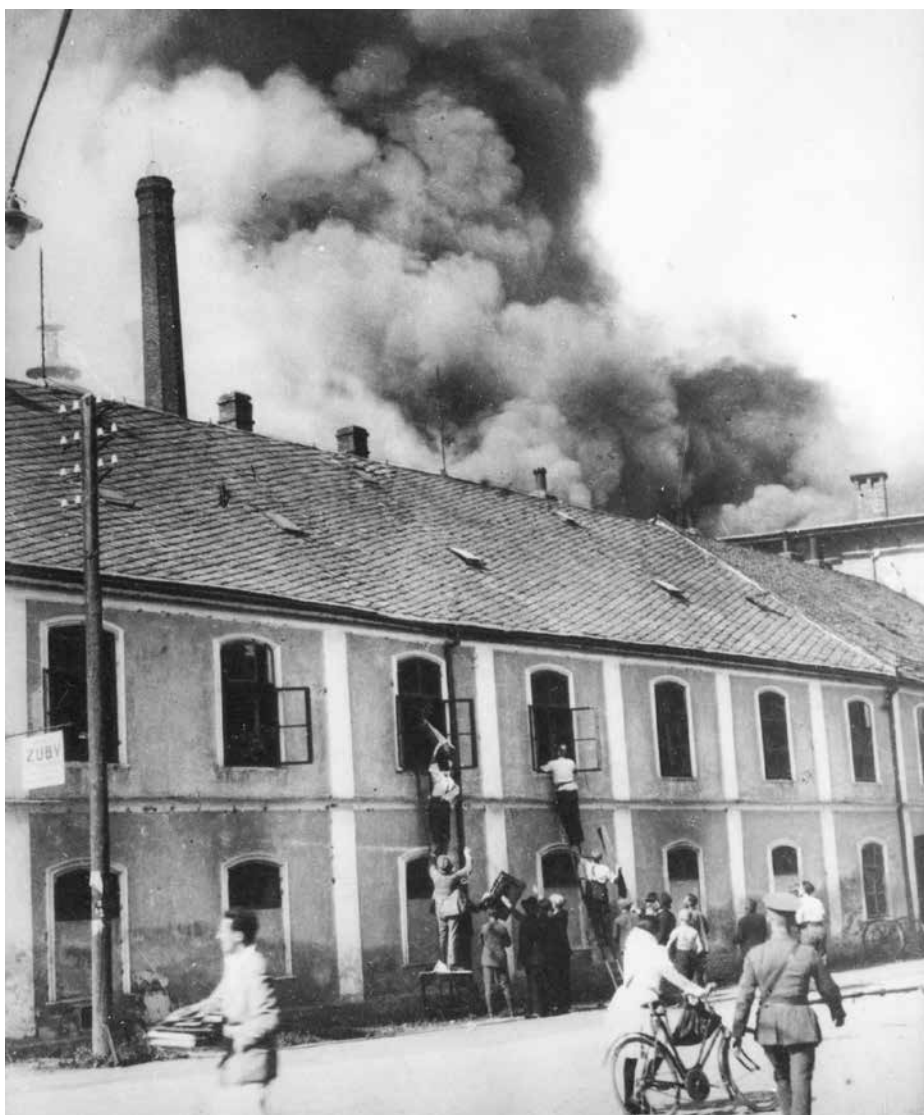
Požár v roce 1928 zcela zničil Fürstovu sladovnu, která stávala v dnešní Všehrdově ulici.

Dobrovolná požární jednota byla nucena se orientovat jen na preventivní službu, jako byly požární zemědělské hlídky