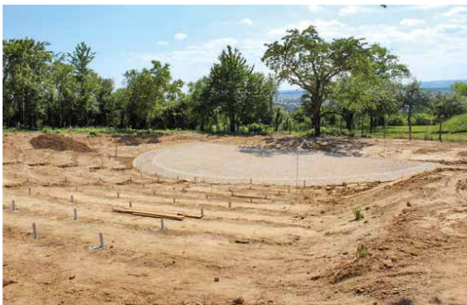
Výstavba amfiteátru na Rochusu je v plném proudu.

Jen pár dnů před spuštěním byli členové rady města také na místě zavedení nové rezidentní zóny v lokalitě Stonky. „Po dobrých zkušenostech z první rezidentní zóny města v Tůních spouštíme rezidentní zónu také v této oblasti. Cílem je zejména ochránit místní obyvatele před parkováním návštěvníků areálu sportoviště a aquaparku. Při sportovních akcích bývají tyto ulice