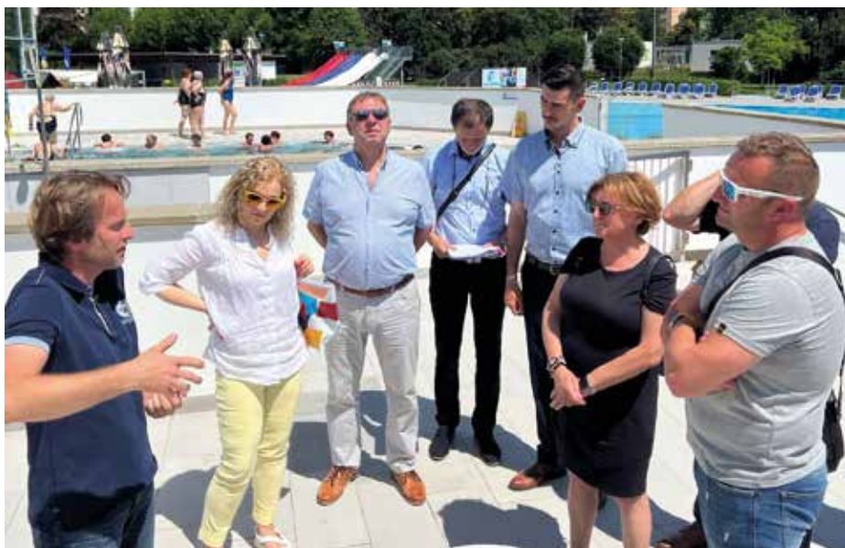
Modernizace aquaparku bude pokračovat.

Rada si prošla také sídliště Štěpnice a projednala zde plán pro zlepšení dalších veřejných prostranství. Pokud se v příštím roce podaří získat potřebnou dotaci, má město v plánu v části sídliště v letech 2026 a 2027 vyměnit nepropustné povrchy komunikací a parkovacích stání za propustné, ale také vybudovat nové plochy pro odpočinek a upravit chodníky ve vnitroblocích. Součástí plánu je také zabudování podzemních kontejnerů, zvelebení zeleně, vybavení míst mobiliárem i herními a vodními prvky. Radní se ve Štěpnicích podívali také na probíhající