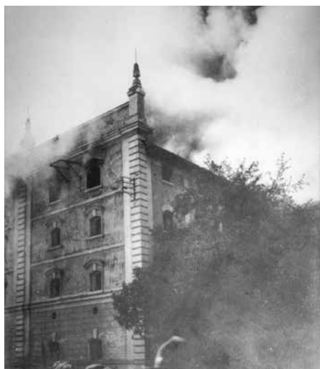
Požár Furstovy sladovny v roce 1928.

V osmdesátých letech 19. století díky přílivu českých řemeslníků a živnostníků do města se sociální a národnostní skladba hasičského sboru výrazně změnila. Porážka německé strany v komunálních volbách v roce 1886 se projevila i v hasičském sboru, když na bouřlivé valné hromadě