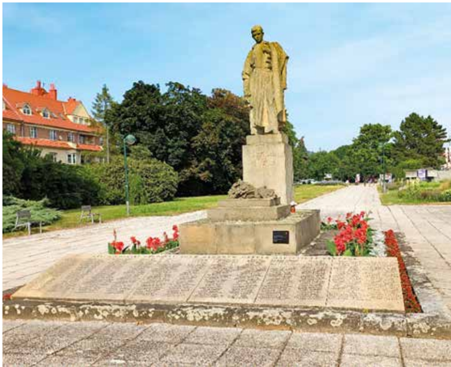
Památník obětem druhé světové války na náměstí Míru.