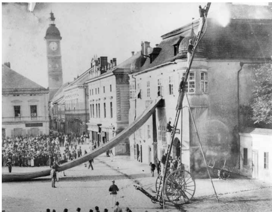
Veřejné hasičské cvičení na dnešním Masarykově náměstí, počátek 20. století.

roku 1890 bylo zvoleno nové předsednictvo sestávající vesměs z českých příslušníků.