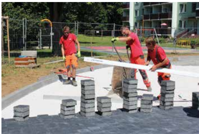
Oprava povrchu silnice a výstavba nových parkovacích míst na sídlišti Štěpnice.

Provoz nového amfiteátru, který bude využívat nejen Park Rochus, ale i příspěvkové či spolupracující organizace pořádající kulturní akce, plánuje město spustit na jaře příštího roku. -JP-