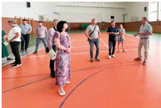
Rada hodnotila i plánovaná energetická opatření ve sportovní hale.