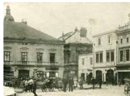
Likvidace požáru, který v roce 1894 vypukl v domě č. p. 146.