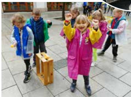
Eko-výchova pro děti.

Současná podoba festivalu čítá mezinárodní fotografickou soutěž, výstavu kaktusů a ekologický program pro děti.