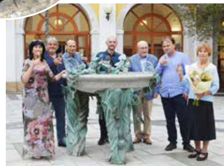
Vernisáž TSTTT se slavnostním předáváním cen.

Zábavných her a skákacích atrakcí si až do 15.00 hodin užily také děti z družin a veřejnost.