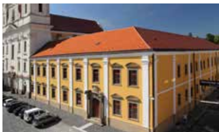
Bývalý jezuitský areál – Reduta, kostel a kolej.

Vedle pastorační činnosti viděli jezuité svůj hlavní úkol ve výchově mládeže. Proto také ihned po svém příchodu otevřeli v domě č. p. 157 gymnázium, po němž později v letech 1724 až