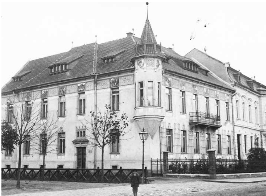
Vlastní dům Dominika Feye se nacházel na nároží dnešní Velehradské třídy a náměti Míru, byl zbourán při výstavbě křižovatky.

Uherskohradištský architekt ovlivnil podobu našeho města, ale i Zlína a dalších míst na Moravě