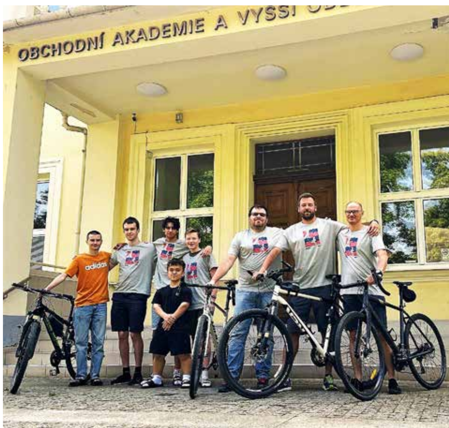
Tým studentů a tým pedagogů Obchodní akademie Uherské Hradiště.