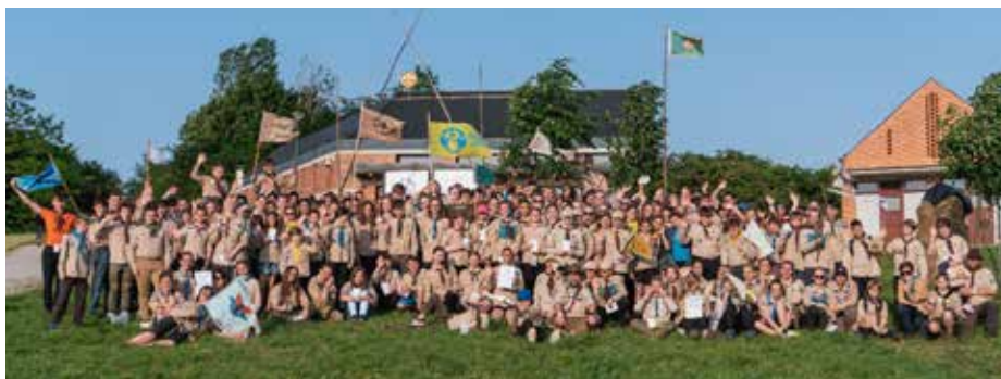
Všichni závodníci před skanzenem.

Na Svojsíkově závodě poměřují družiny své síly každé dva roky. O to větší událostí byla možnost pořádání právě v našem městě. Uherskohradištské středisko Psohlavci se ujalo výzvy a několik měsíců chystalo velkolepou akci zahrnující na téměř 150 závodníků a více než 100 rozhodčích. Jen najít místo pro závody takového rozsahu, kde si účastníci na celý víkend postaví tábořiště, nebylo rozhodně jednoduché. O to více si pořadatelé pochvalovali spolupráci se skanzenem Rochus, který vyslyšel všechny náročné požadavky. Na skauty a skautky tak čekalo nejen perfektní zázemí, ale i prohlídky samotného