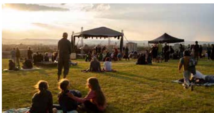
Pohoda na Výšině sv. Metoděje.