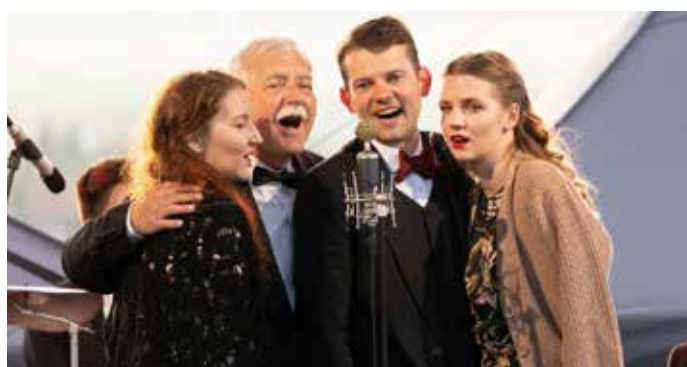
Vystoupení kapely Melody Gentlemen.