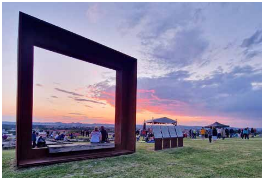
Pohled na Výšinu sv. Metoděje ve světle zapadajícího slunce.