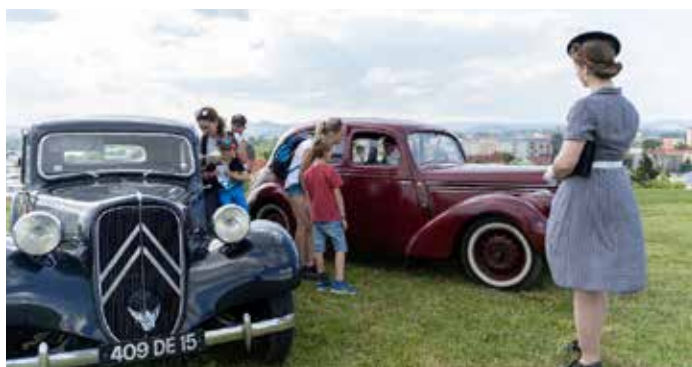
Velkou atrakcí byly historické automobily.