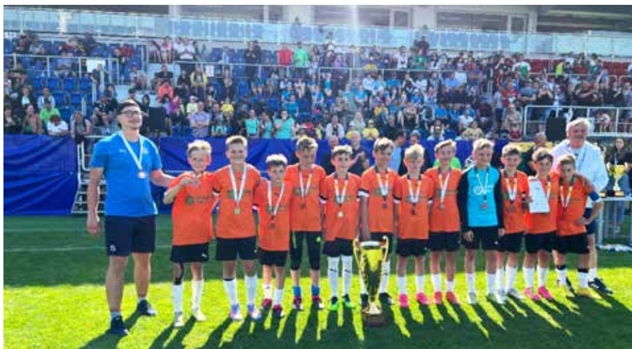
Skvělé třetí místo na Mc Donald's Cupu (nahore), starší žáci na republikovém finále v přespolním běhu (dole).

Mc Donald's Cup je největší fotbalový turnaj pro žáky 1. až 5. ročníků základních škol. Jeho 24. ročník se po devíti letech vrátil do Uherského Hradiště a Základní škola Sportovní se stala opět spoluorganizátorem. Ve dnech 29. a 30. května se do našeho města sjeli reprezentanti nejlepších šestnácti týmů ve dvou věkových kategoriích (A, B) a poprvé také osm nejlepších týmů malotřídních škol, aby bojovali o co nejlepší umístění, medaile a poháry. Nechyběli u toho ani reprezentanti