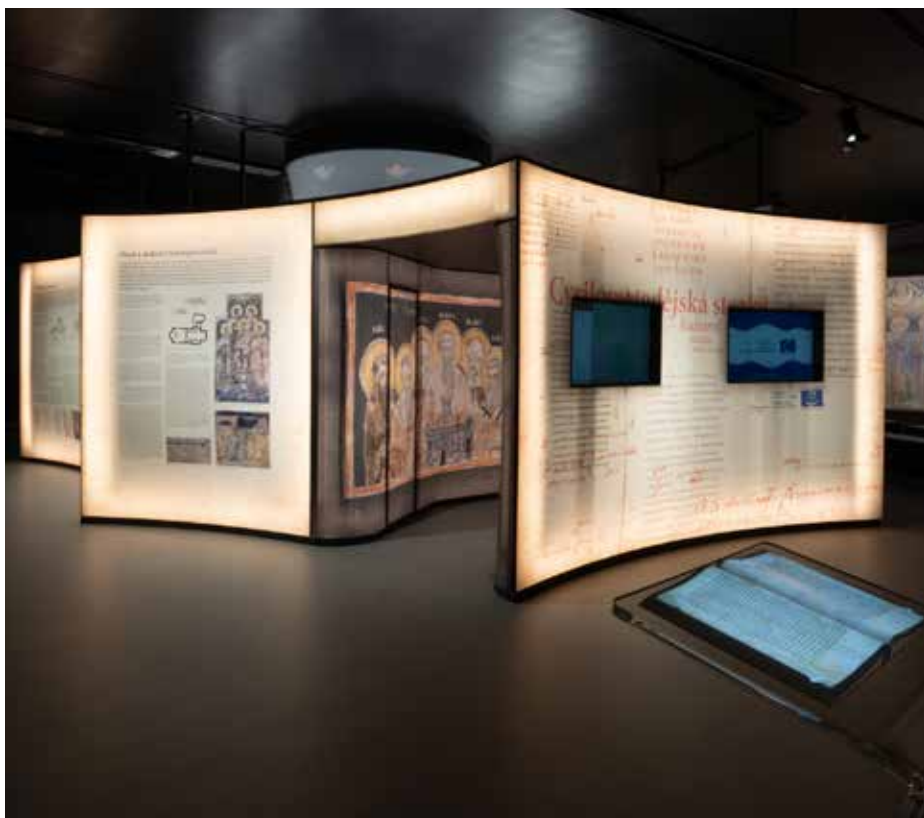
Unikátní projekt Cyrilometodějského centra ve Starém Městě, pohled do oceňované multimediální expozice Příběh Konstantina a Metoděje.