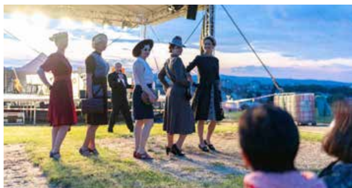
Nechyběla přehlídka módy první republiky.