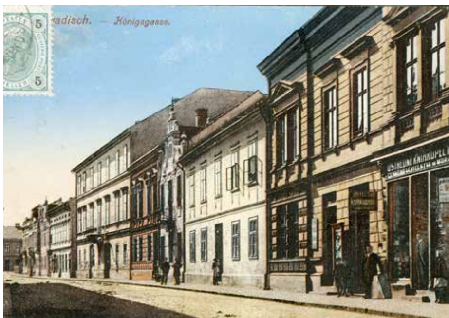
Přední část domu č.p. 27 v Nádražní ulici projektoval D. Fey v roce 1905.

1899 zpracoval návrh rodinného domu pro továrníka Zikmunda Fürsta, stavba však byla realizována podle projektu olomouckého stavitele Franze Langera v roce 1901.