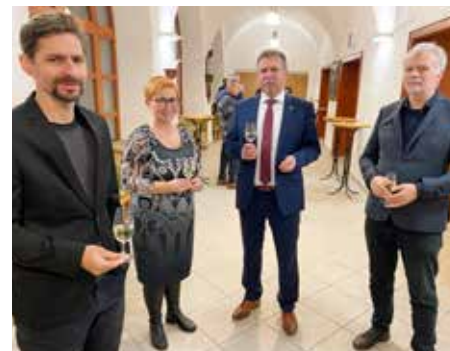
Při vernisáži byl čas i na neformální debaty.

Součástí architektonické podstaty celého areálu je obvodová zeď vymezující vnitřní dvory. Chtěli jsme tyto dvory zachovat, svými předprostory totiž připomínají zámecký areál, a proto pro nás bylo důležité i jejich ideové ztvárnění a bezprostřední návaznost na celý blok. Během práce na soutěžním návrhu jsme se snažili správně definovat a najít rozumnou míru otevření zdi k městu. Pozice věznice v centru města, její symbolický význam i měřítko, nabízí možnost celý areál přiměřeně a důstojně zapojit do chodu města, a dát mu tím nový impuls. Pokud budeme na projektu dále pracovat, jistě toto budou hlavní témata. Najít řešení, jak areál rozumně otevřít a zároveň zachovat