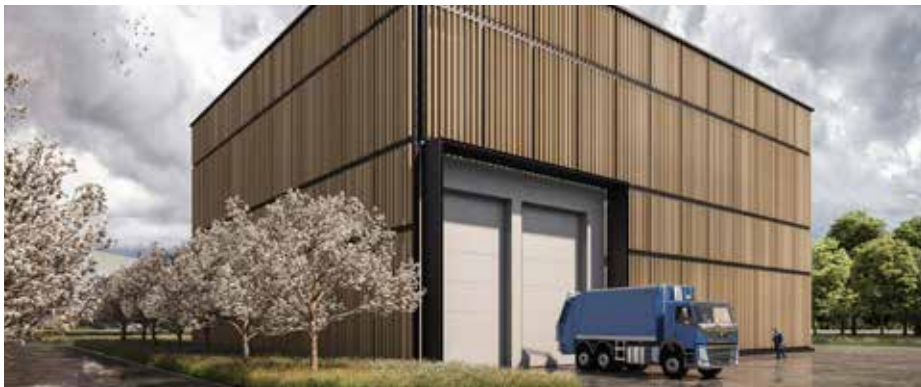
Dřevěné obložení budovy podtrhuje ekologický aspekt zařízení.

Další důležitý krok: Krajský úřad zahájil posuzování vlivu na životní prostředí