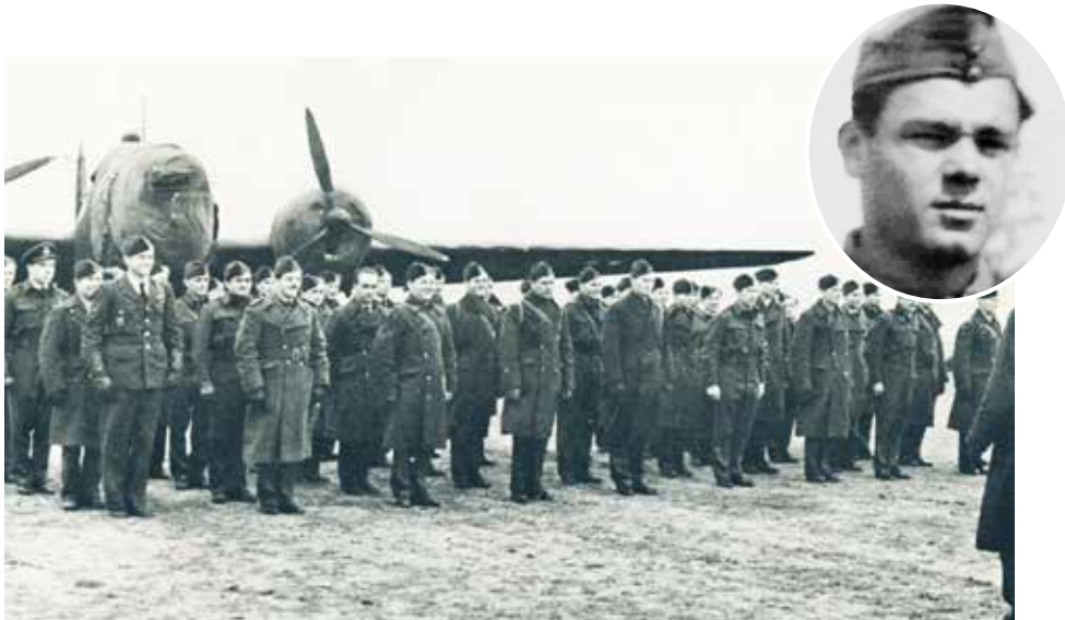
Vojáci 311. československé bombardovací perutě RAF seřazení před bobmardérem Vickers Wellington.

Po jeho skončení byl přeložen k letectvu a 12. června 1942 byl přijat do RAF a převelen na základnu Saint Athan v jižním Walesu. Po výcviku na palubního radiotelegrafistu v Evantonu, kde