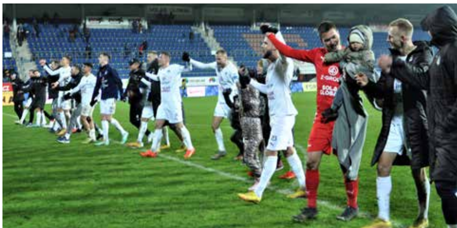
Zasloužená radost po postupu do čtvrtfinále poháru.

Po dovolené se všichni sešli již 27. prosince na zahájení zimní přípravy. Od 14. do 11. ledna čeká mužstvo herní soustředění v Turecku, počítá se se dvěma přípravnými zápasy.