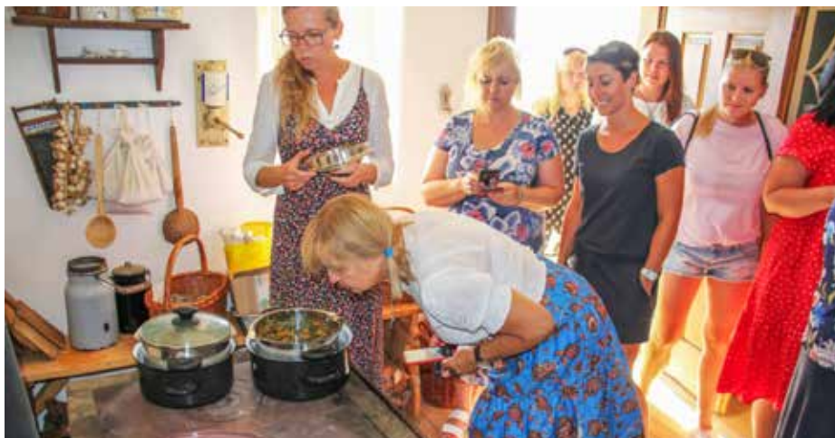
Návštěvníci mohli vidět i přípravu tradičních slováckých pokrmů a samozřejmě je taky ochutnali.

Toto téma se tak prolínalo akcemi pro veřejnost i programy pro školy. Vytvořen byl stejnojmenný výukový program pro žáky 2. stupně základních a studenty středních škol, který