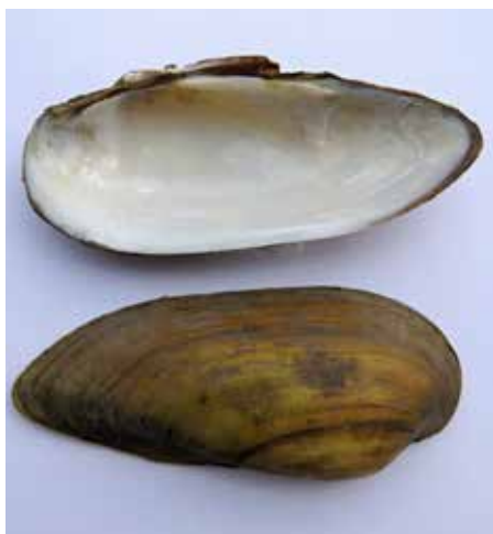
Lastury velevruba malířského z Baťova kanálu.

Na dně řeky Moravy, na dně slepých ramen i dalších vodních ploch ve městě a blízkém okolí sídlí řada živočichů. K zajímavým patří velcí mlži – různé druhy škeblí a také jejich nejbližší příbuzní, méně známí velevrubi.