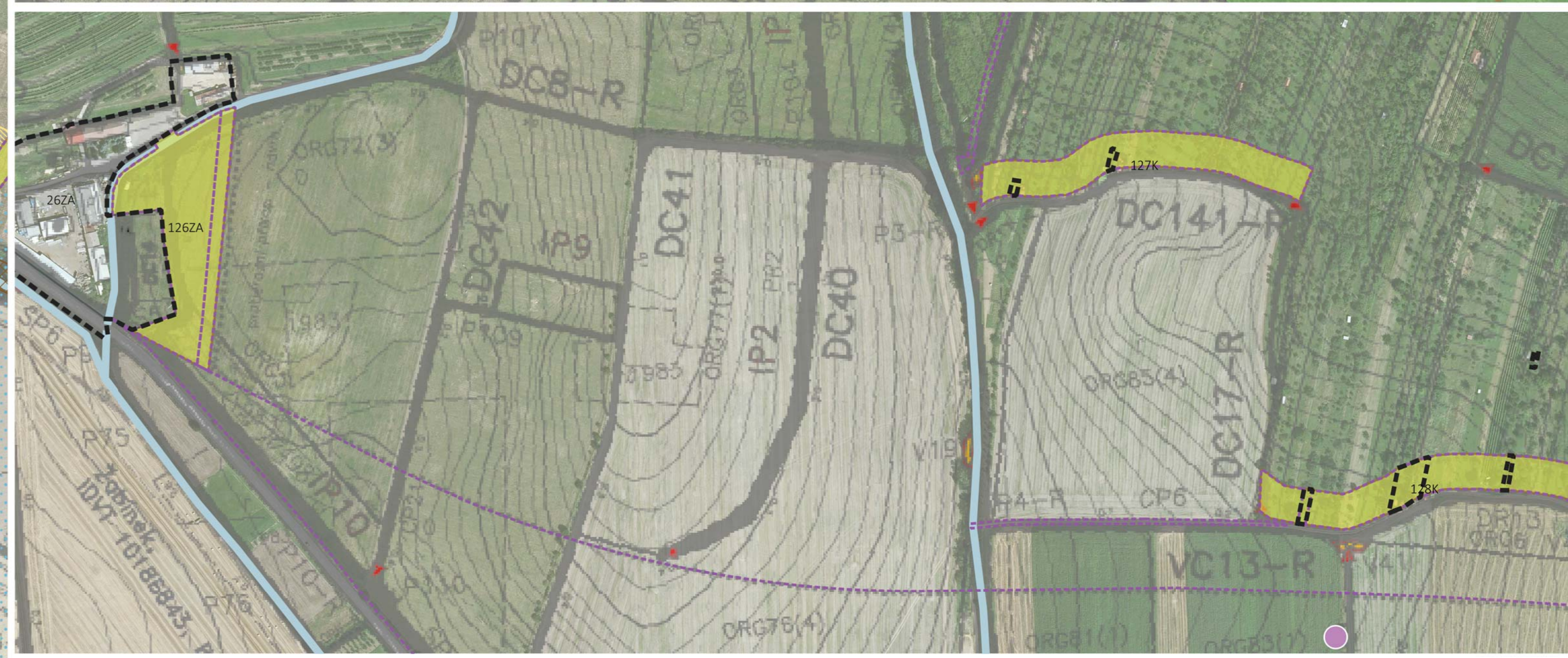
SCHEMA MAPOVÝCH LISTŮ