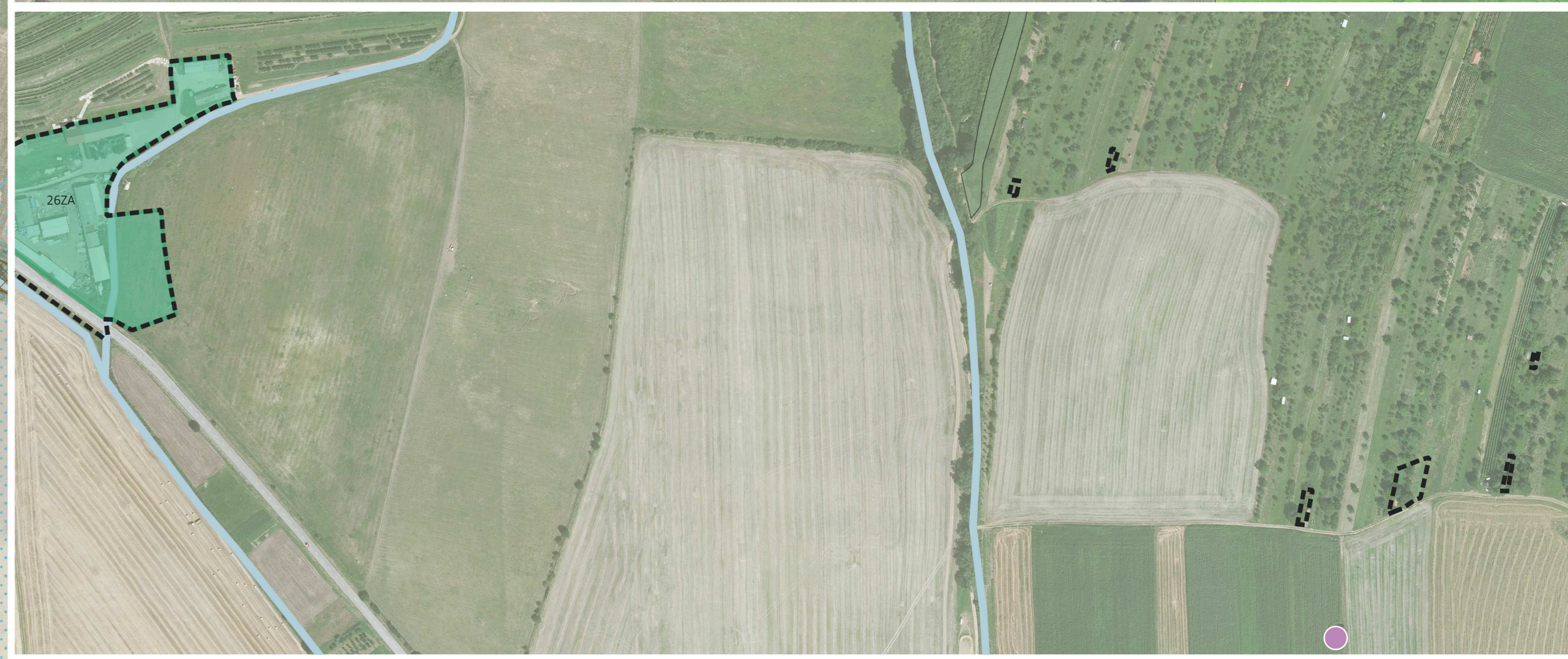
SCHEMA MAPOVÝCH LÍSTŮ