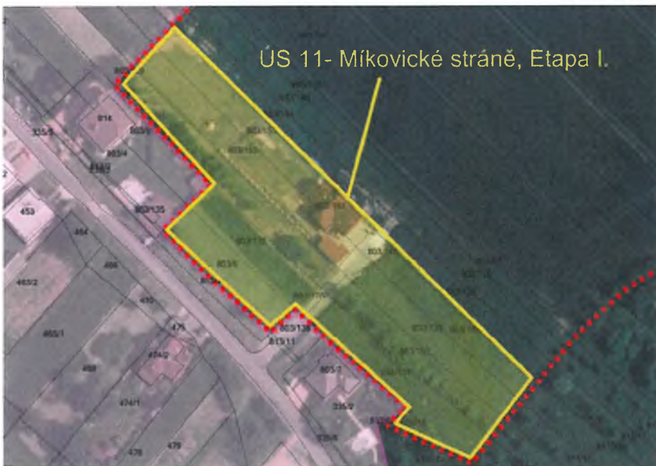
Vymezení Etapy I. ÚS 11 – Míkovicke stráně v ÚP Uherské Hradiště

Řešené území zahrne i nezbytné širší souvislosti vycházející z řešení dopravní a technické infrastruktury. Nezbytnými širšími souvislostmi se rozumí umožnit dostatečně kapacitní obsluhu zbývajících zastavitelných ploch v rámci ÚS 11 – Míkovicke stráně; v lokalitě lze reálně předpokládat výstavbu cca 75 rodinných domů (závěr učiněný ze skutečného vývoje území a z již dříve zpracované „Studie zainvestování území Míkovicce – ulice Hlavní, S-projekt plus a.s. 2000).