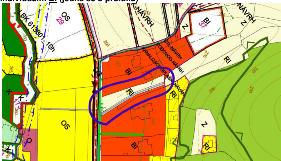
Orientační zaznačení požadované lokality v Koordinačním výkresu Územního plánu Břestek ve znění Změny č. 1.

Poznámka: Návrh na změnu ÚP předložený navrhovatelem byl doplněn o podmínku obce uvedenou v usnesení o schválení změny – respektováno (vymezena je stávající plocha pro bydlení individuální BI, která nezasahuje do koryta přirozené vodoteče, tato vodoteč se nachází v rámci sousední plochy veřejných prostranství s převahou zpevněných ploch PV)