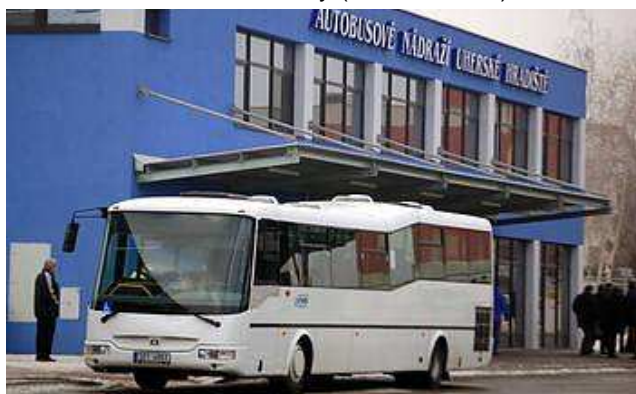
ilustrační foto zdroj Slovácký deník

Příspěvek města na pořízení dlouhodobého hmotného investičního majetku – nízkopodlažního autobusu, z důvodu obnovy (modernizace) vozového parku pro zajištění MHD.