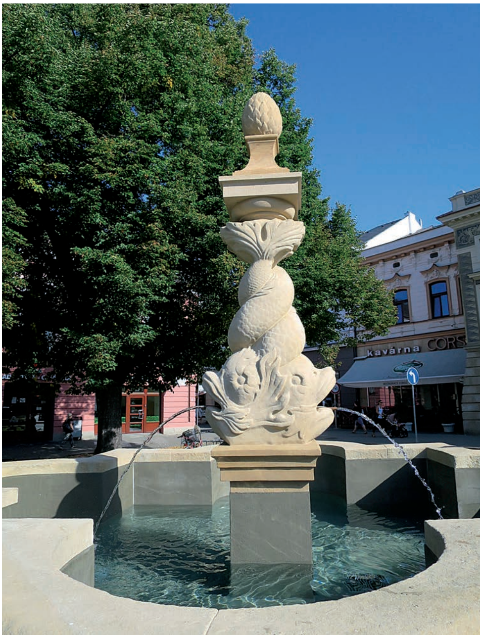
Rekonstrukce kašny Masarykovo náměstí