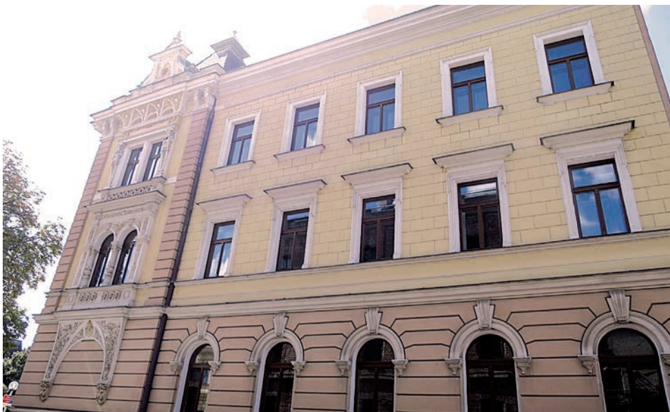
Dům Palackého nám. č. p. 238 – výměna oken a dveří