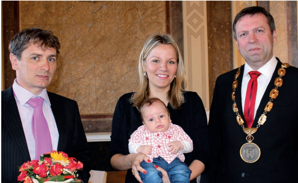
První občánek města 2017