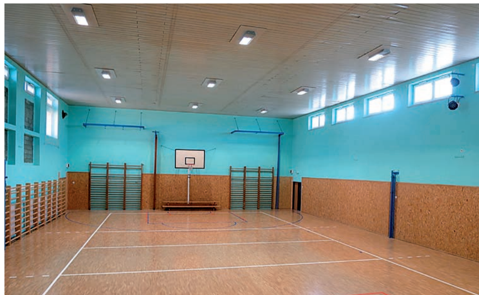
Rekonstrukce tělocvičny ZŠ Jarošov