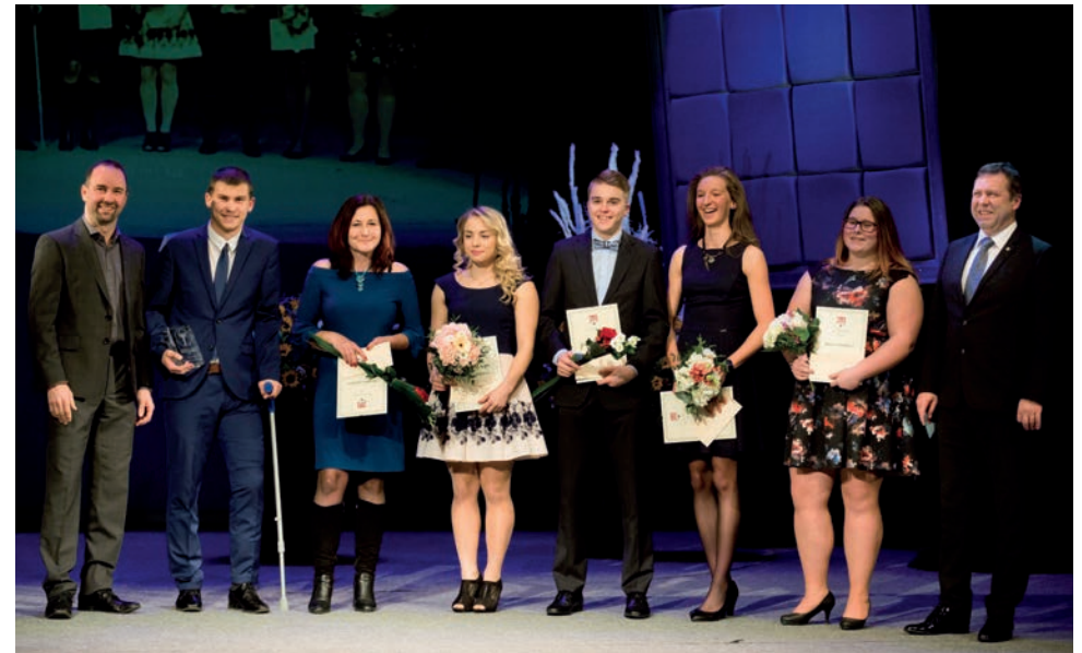
Ocenění nejlepších sportovců