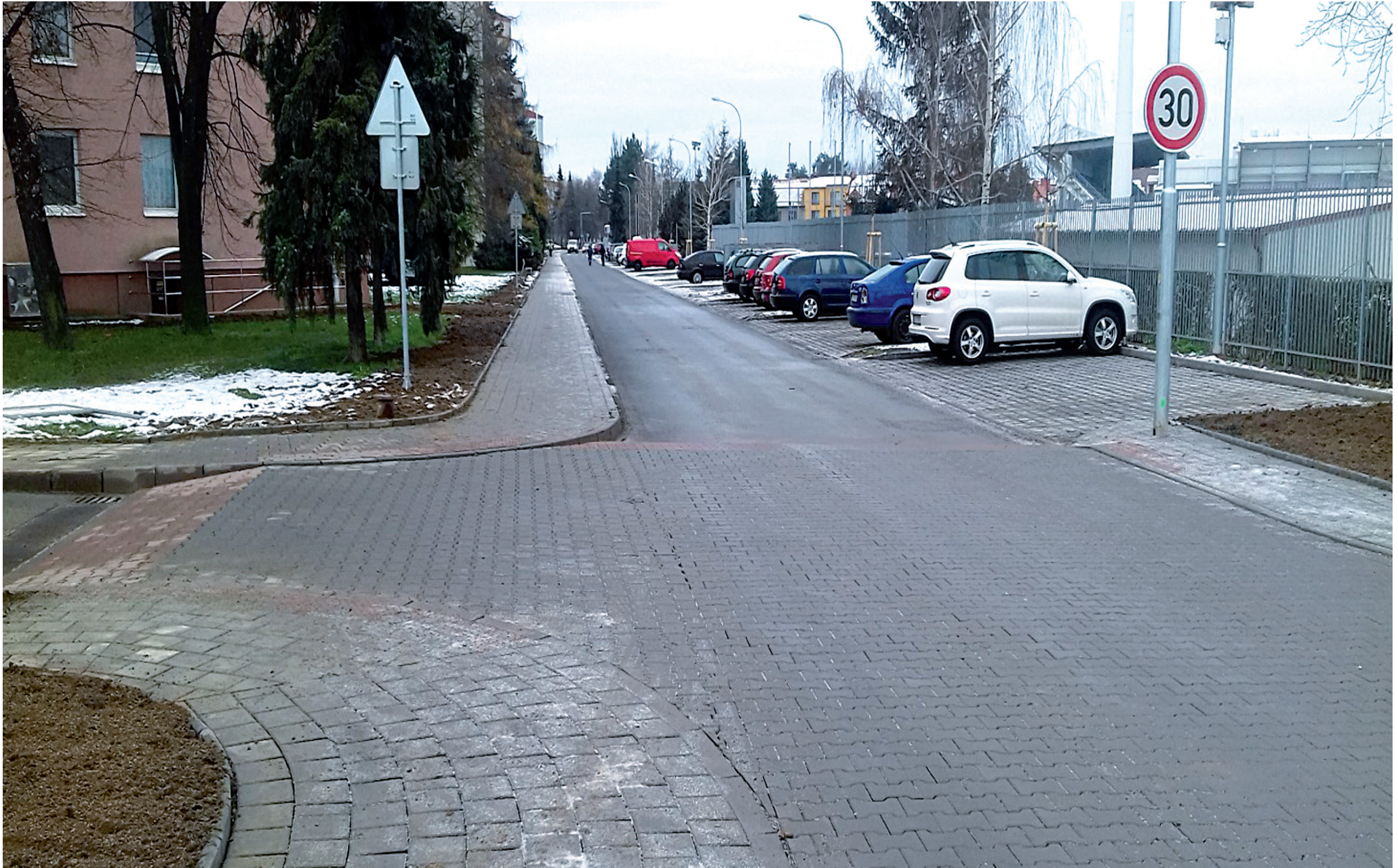
Revitalizace sídliště 28. října