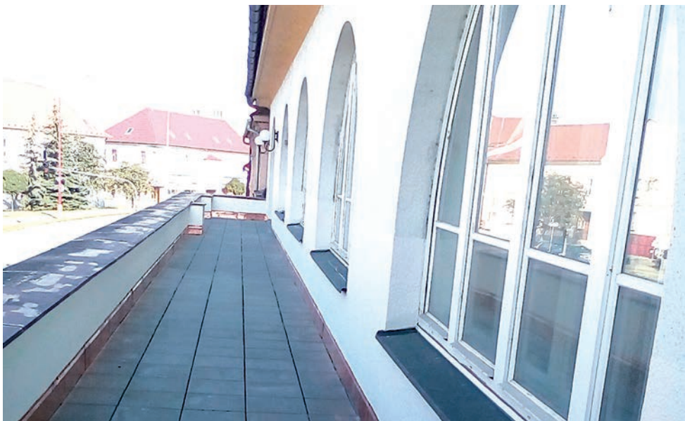
Slovácké divadlo – rekonstrukce terasy