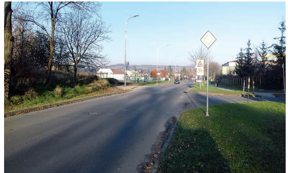
Rekonstrukce veřejného osvětlení v ul. Větrná