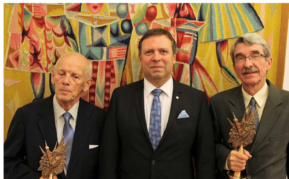
Cena města Uherské Hradiště