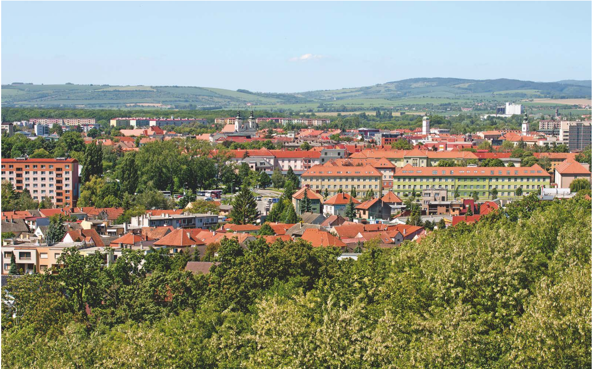
Pohled na Uherské Hradiště