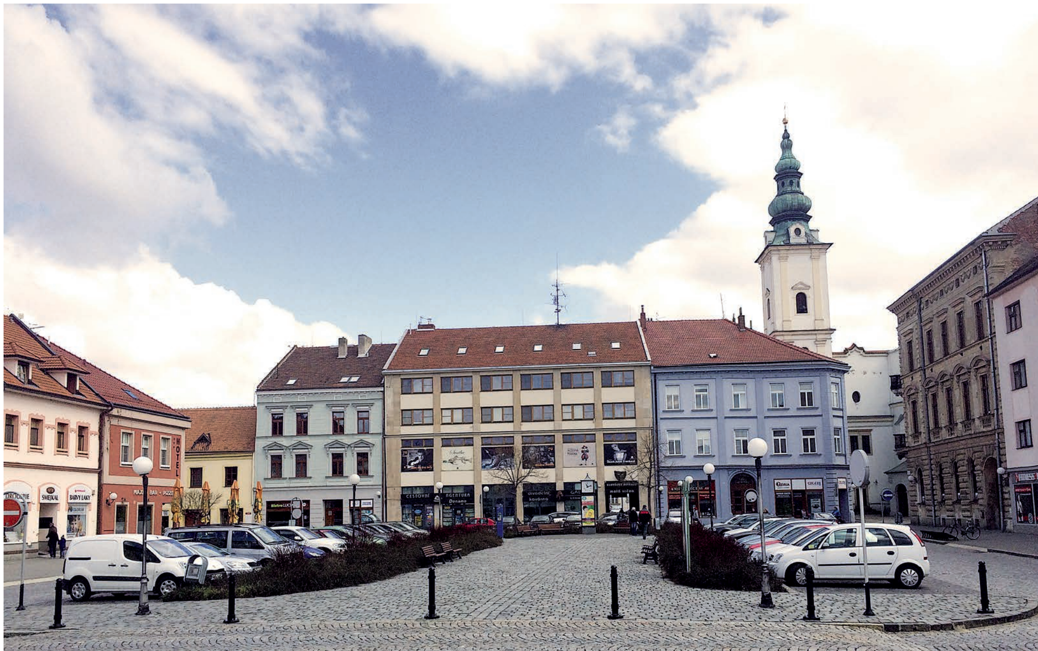
Mariánské náměstí v Uherském Hradišti