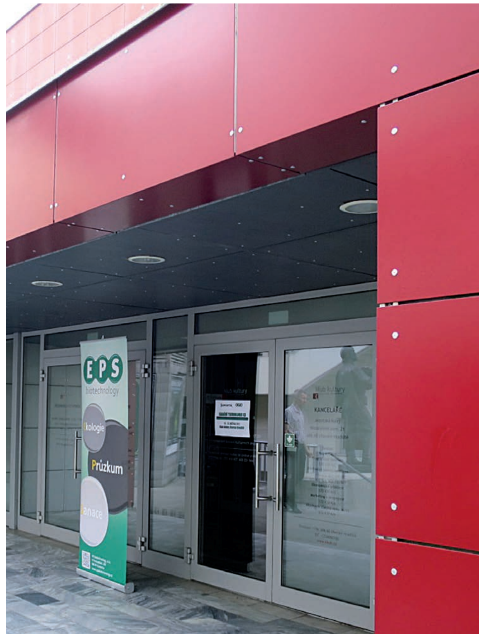
Klub kultury – výměna části obkladu obvodového pláště