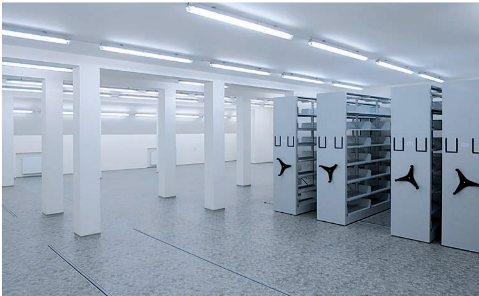
Depozitář knihovny Mařatice