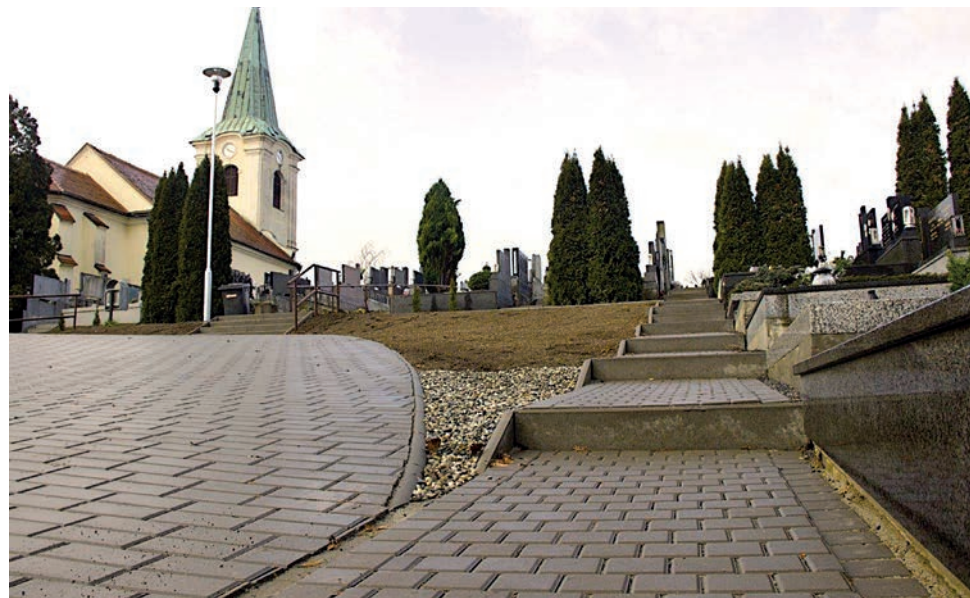
Oprava chodníků pohřebiště Sady