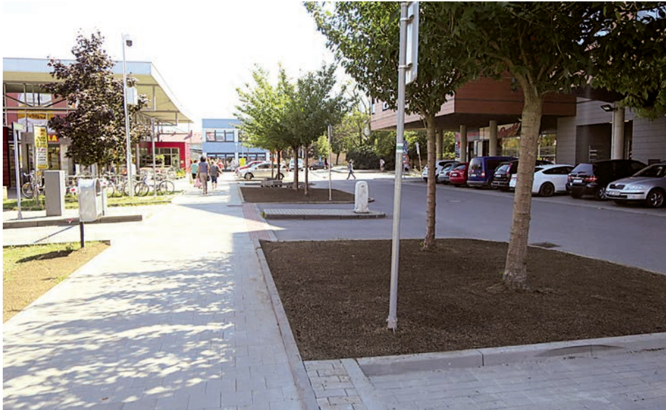
Bezbariérová trasa, úsek Na Stavidle – autobusové nádraží