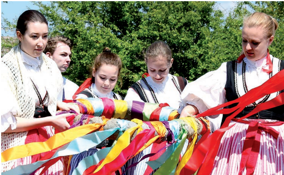
Stavění máje a otevírání pastvin na Rochusu