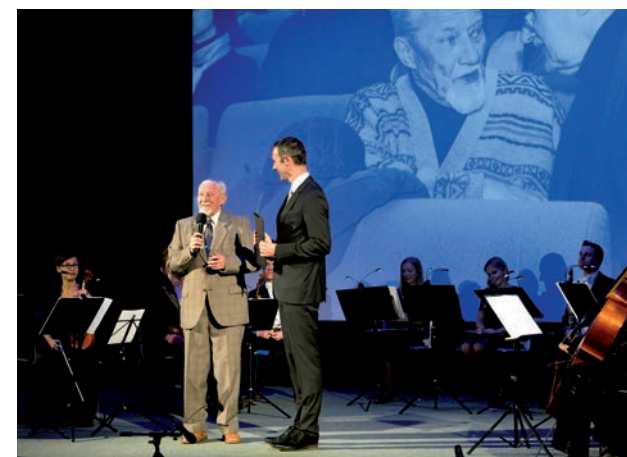
50 let kina, slavnostní pořad Večer-nice 30. 9. 2017

Limitujícím ekonomickým faktorem (zejména projektových akcí a cyklů) je stále se snižující podpora ze strany státních institucí, stejně jako ostatních donátorů. Přesto se podařilo získat dotaci ve výši 200 000 korun od Ministerstva kultury ČR na dva projekty, a to na projekt UKUH 2017 ve výši 80 000 Kč a na projekt Filmová a audiovizuální výchova v kině Hvězda ve výši 120 000 Kč. V roce 2017 byly tyto negativní vlivy naštěstí kompenzovány vyšší diváckou návštěvností. Ta je do zásadní míry závislá na distributorské nabídce. Naše programování je dramaturgicky pružné a reaguje aktivně