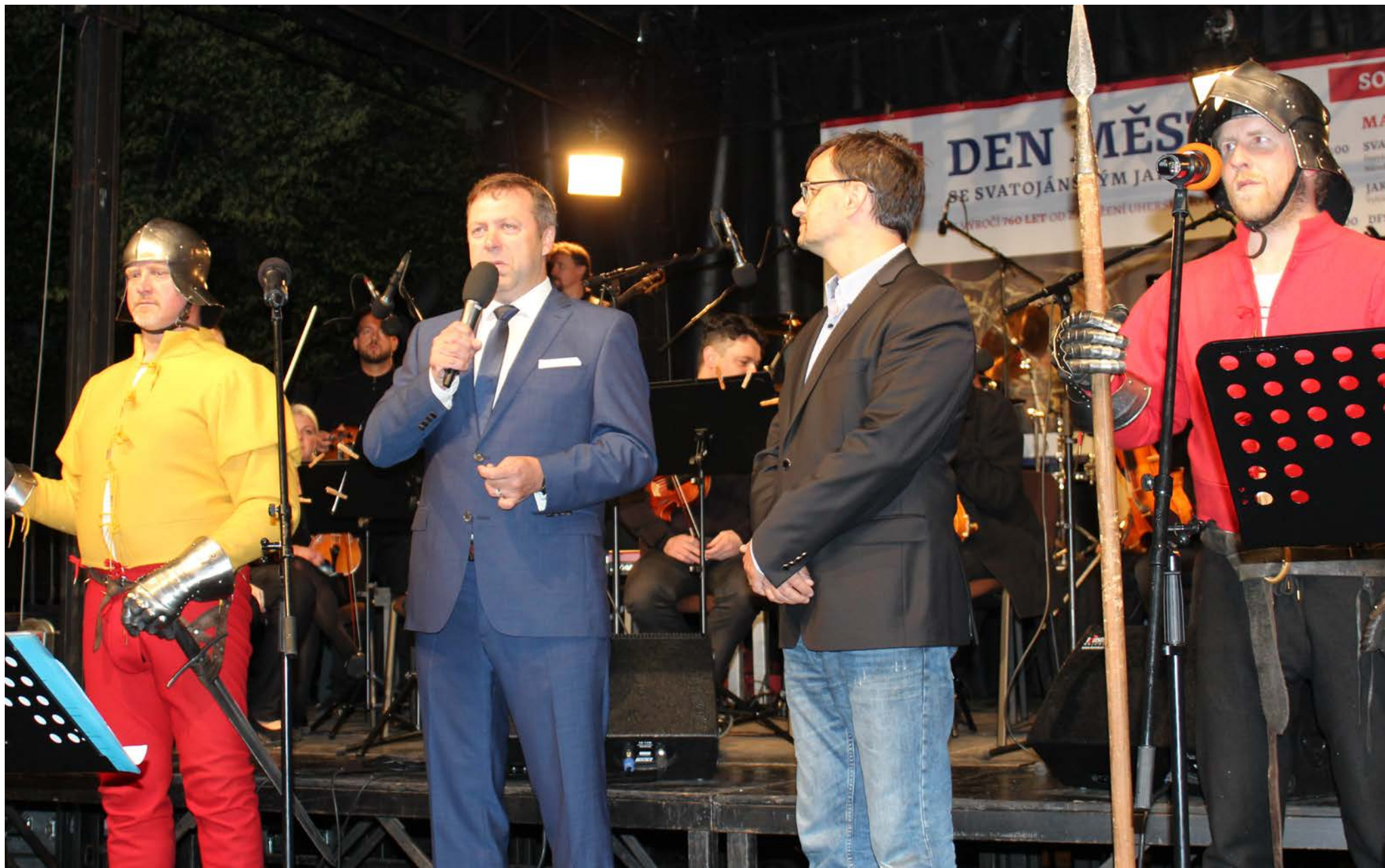
Den města Uherské Hradiště - slavnostní koncert