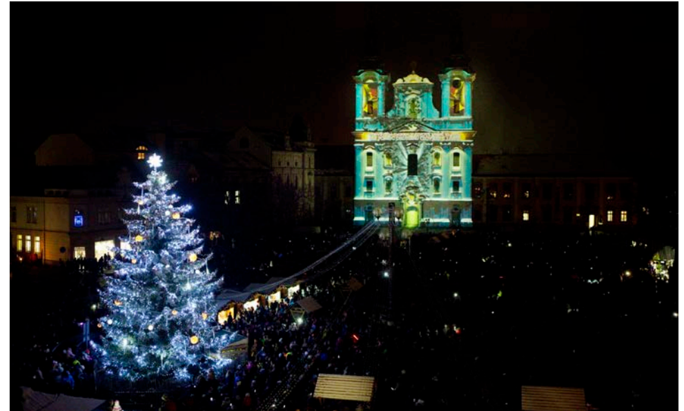
Slavnostní rozsvěcování vánočního stromu