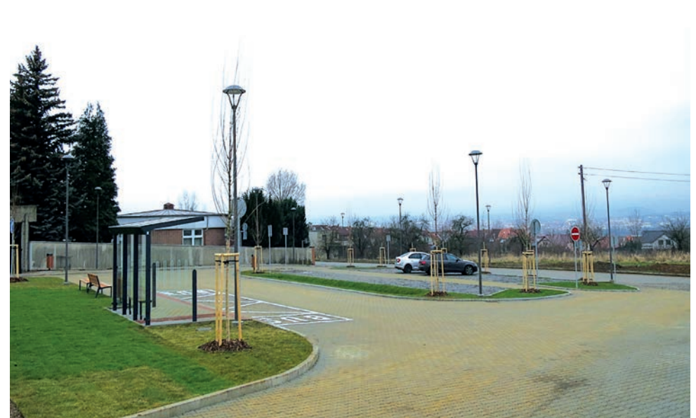
Parkování u hřbitova, Mařatice – I. etapa