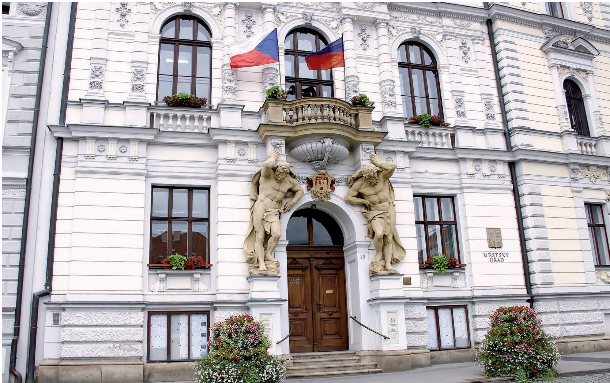
Radnice Uherské Hradiště